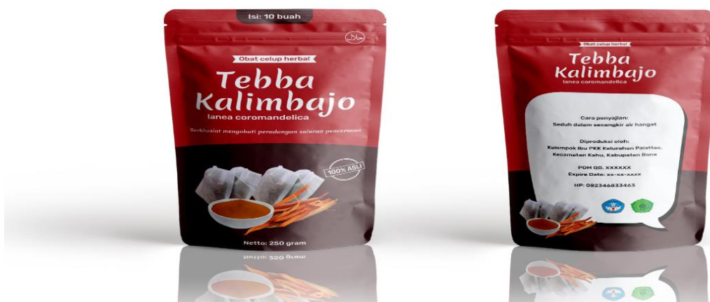
Gambar 4. Kemasan Produk Obat Celup Herbal Tebba Kalimbajo

Proses pendampingan yang dilakukan yaitu melalui via daring atau online , di mana mitra mempraktekkan sendiri cara pembuatan obat celup peradangan dan memberikan penjelasan tentang keluhan atau apa yang kurang dipahami oleh mitra. Pendampingan dilakukan untuk mengetahui kemampuan mitra dalam membuat produk sekaligus kemampuan mitra yang akan mengembangkan produk yang dihasilkan. Pendampingan juga diharapkan mitra mampu melakukan pengemasan produk sehingga produk memiliki nilai ekonomis yang tinggi. Produk rancangan kemasan teba kalimbajo celup sebagai berikut.