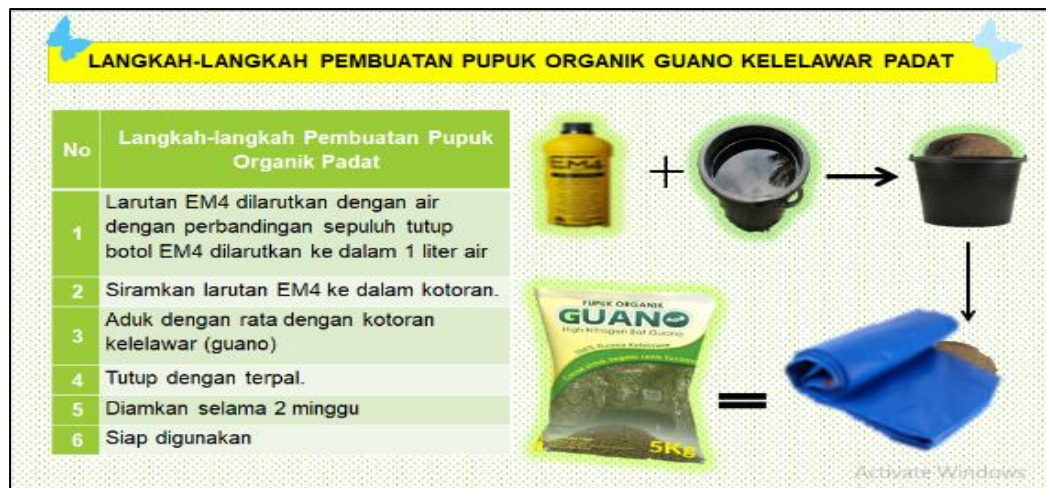
Gambar 6. Langkah-langkah pembuatan pupuk organik guano keelawar padat

Adapun tata cara pembuatan pupuk organik guano keelawar dalam bentuk padat cukuplah mudah. Dengan menambahkan EM4 sebanyak 10 tutup botol dengan air, kemudian diaduk dengan rata, dan didiamkan selama 2 minggu menggunakan terpal. Gambar 6 menunjukkan langkah-langkah pembuatan pupuk organik guano keelawar padat dan pembuatan oleh mitra.