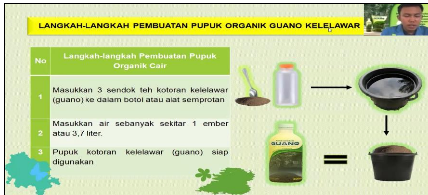
Gambar 5. Langkah-langkah pembuatan pupuk organik guano keelawar cair

Adapun tata cara pembuatan pupuk organik guano keelawar dalam bentuk padat cukuplah mudah. Dengan menambahkan EM4 sebanyak 10 tutup botol dengan air, kemudian diaduk dengan rata, dan didiamkan selama 2 minggu menggunakan terpal. Gambar 6 menunjukkan langkah-langkah pembuatan pupuk organik guano keelawar padat dan pembuatan oleh mitra.