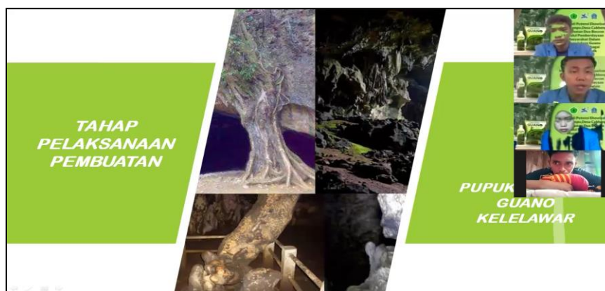
Gambar 4. Penyuluhan pembuatan pupuk organik guano kelelawar yang mengenai tata cara pembuatan pupuk organik guano kelelawar.

Pelatihan pembuatan pupuk organik guano kelelawar yaitu tentang tata cara pembuatan pupuk organik guano kelelawar. Adapun tahap pelaksanaannya dimulai dari pengenalan alat dan bahan yang digunakan dalam proses pembuatan pupuk organik guano kelelawar, dilanjutkan dengan penjelasan mengenai tata cara pembuatan pupuk organik guano kelelawar cair dan tata cara pembuatan pupuk organik guano kelelawar padat. Gambar 4 menunjukkan peserta penyuluhan pembuatan pupuk organik guano kelelawar yang menerima materi tata cara pembuatan pupuk organik guano kelelawar.