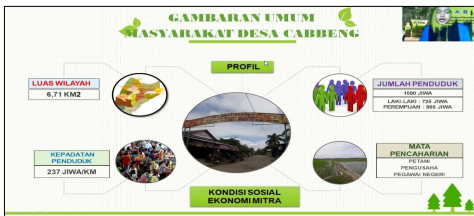
Gambar 2. Penyuluhan pembuatan pupuk organik guano kelelawar mengenai potensi desa

Materi kedua ini membahas berbagai aspek dimulai dari luas wilayah, kepadatan penduduk, jumlah penduduk di Desa Cabbeng, dan mata pencaharian yang ada disana. Dijelaskan pula, potensi apa saja yang ada di Desa Cabbeng mengingat jumlah penduduk yang cukup banyak. Gambar 2 menunjukkan peserta penyuluhan pembuatan pupuk organik guano kelelawar yang menerima materi tentang gambaran umum masyarakat Desa Cabbeng Kecamatan Dua Boccoe Kabupaten Bone.