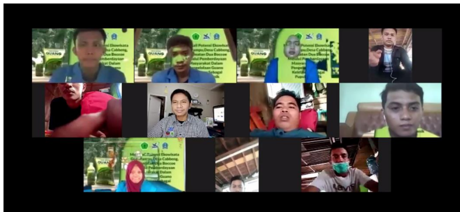
Gambar 7. Pendampingan mitra BUMDes Tompoe secara daring.

Pendampingan dilaksanakan secara daring untuk mengetahui permasalahan mitra setelah pelatihan dilaksanakan. Pelatihan bertujuan untuk mengevaluasi kemampuan mitra dalam mengembangkan produk yang dihasilkan oleh kotoran kelelawar. Dari hasil pendampingan mitra diharapkan mampu membuat pupuk organik dari guano kelelawar.