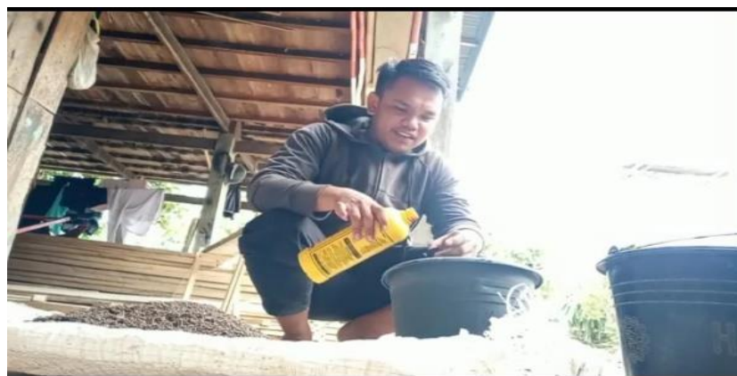
Gambar 7. Langkah-langkah pembuatan pupuk organik guano keelawar padat dan pembuatan oleh mitra.