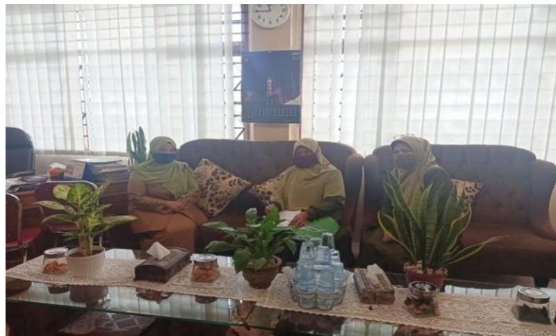
Gambar 2. Kunjungan Ke Kantor Dinas Sosial Kota Bukittinggi

Kunjungan ke kantor Dinas Sosial Kota Bukittinggi dilakukan oleh Tim PKM pada tanggal 15 Juni 2020 dengan tujuan untuk mendapatkan informasi terkait dengan maraknya kejadian pelecehan seksual di masyarakat, dan beberapa diantaranya melakukan terhadap anak-anak tunarungu