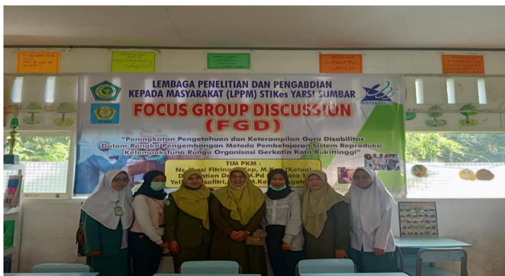
Gambar 3. Acara Focus Group Discussion

FGD dilaksanakan dalam rangka persiapan kegiatan PKM, telah dilaksanakan pada tanggal 27 Juli 2020 di SD Al Azhar Kota Bukittinggi.