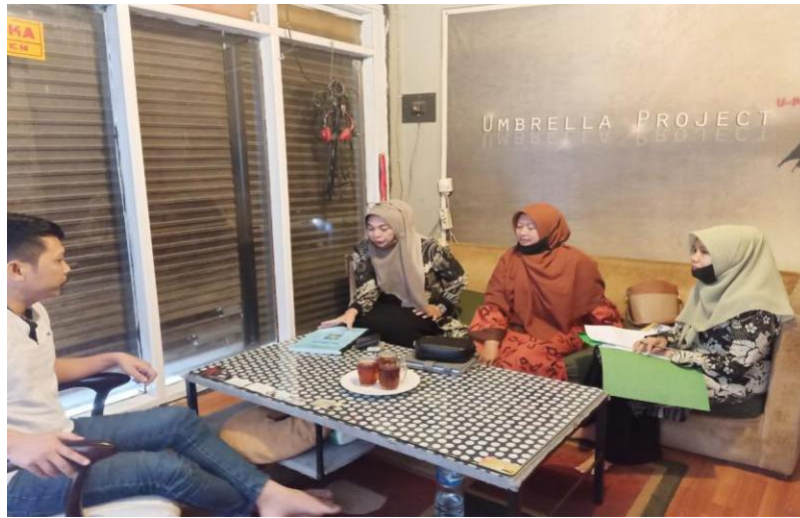
Gambar 1. Kunjungan ke GerkatIn Kota Bukittinggi