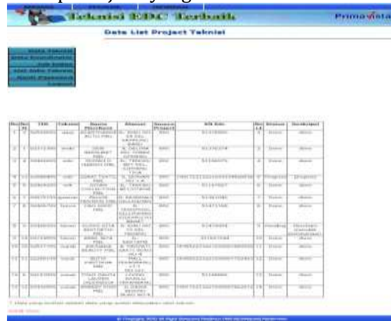
Gambar 10. Halaman List Jobs Teknisi

Halaman ini berisi hasil dari pekerjaan yang telah dilakukan oleh teknisi.