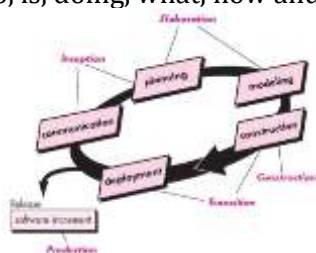
Gambar 2. Unified Process