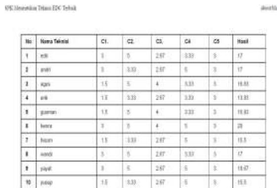
Gambar 11. Halaman Output Seleksi

Halaman ini berisi hasil penilaian seleksi Sistem Pendukung Keputusan Teknisi EDC Terbaik.