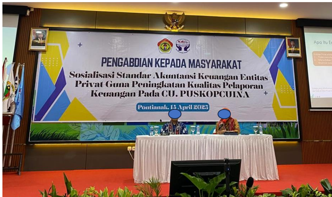
Gambar 3. Penyampaian Materi Narasumber Kedua

Beliau menyoroti bahwa SAK EP hadir sebagai jawaban atas kebutuhan pelaporan keuangan yang lebih relevan, ringkas, dan mudah diterapkan oleh entitas privat, terutama yang memiliki sumber daya terbatas dalam mengelola laporan keuangan sesuai dengan PSAK umum yang kompleks. Dr. Sartono juga memaparkan proses penyusunan SAK-EP oleh Dewan Standar Akuntansi Keuangan (DSAK) serta dasar hukum yang melandasinya, termasuk harmonisasi dengan standar internasional, yaitu IFRS for SMEs. Penjelasan ini memberikan pemahaman mendasar kepada peserta mengenai alasan mengapa SAK-EP menjadi penting untuk diadopsi oleh CU dan entitas sejenis, serta bagaimana implementasinya dapat meningkatkan transparansi dan akuntabilitas laporan keuangan secara berkelanjutan. Materi disampaikan secara interaktif, sehingga mendorong partisipasi aktif peserta dalam sesi tanya jawab yang berlangsung dengan antusias.