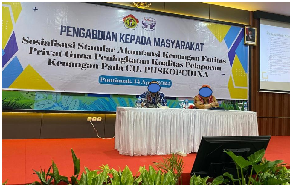
Gambar. 2 Penyampaian Materi Narasumber Pertama

Beliau menyoroti bahwa SAK EP hadir sebagai jawaban atas kebutuhan pelaporan keuangan yang lebih relevan, ringkas, dan mudah diterapkan oleh entitas privat, terutama yang memiliki sumber daya terbatas dalam mengelola laporan keuangan sesuai dengan PSAK umum yang kompleks. Dr. Sartono juga memaparkan proses penyusunan SAK-EP oleh Dewan Standar Akuntansi Keuangan (DSAK) serta dasar hukum yang melandasinya, termasuk harmonisasi dengan standar internasional, yaitu IFRS for SMEs. Penjelasan ini memberikan pemahaman mendasar kepada peserta mengenai alasan mengapa SAK-EP menjadi penting untuk diadopsi oleh CU dan entitas sejenis, serta bagaimana implementasinya dapat meningkatkan transparansi dan akuntabilitas laporan keuangan secara berkelanjutan. Materi disampaikan secara interaktif, sehingga mendorong partisipasi aktif peserta dalam sesi tanya jawab yang berlangsung dengan antusias.