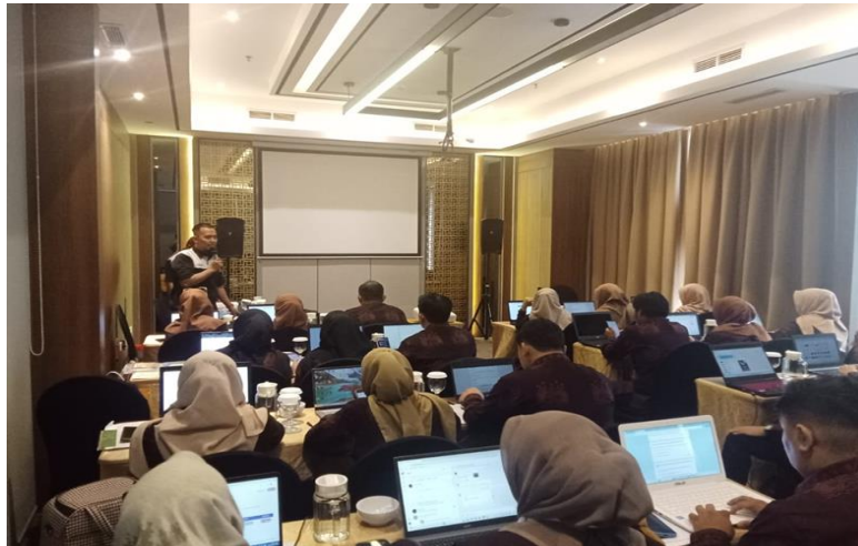
Gambar 4. Foto Peserta dalam Pengerjaan Uji Kompetensi

Uji kompetensi dilakukan sebagai evaluasi terhadap proses pelatihan dan pendampingan yang telah dilakukan selama 2 (dua) sebelumnya. Berikut gambaran aplikasi peserta ujian pada plafon "Si Kompeten".