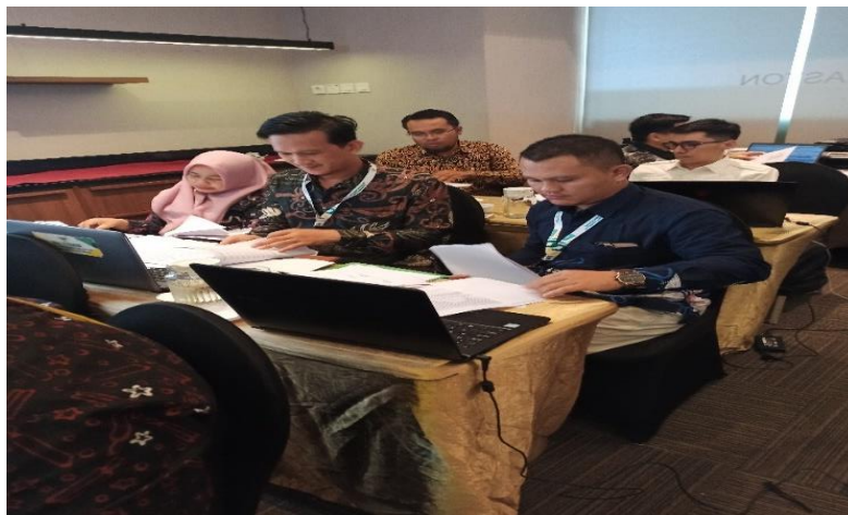
Gambar 3. Foto Peserta dalam Pengerjaan Tugas Praktek

Selama proses pendampingan terlihat semua peserta sangat antusias mengerjakan semua tugas penyusunan laporan keuangan tersebut. Gambaran pendampingan dapat dilihat pada gambar di bawah ini.