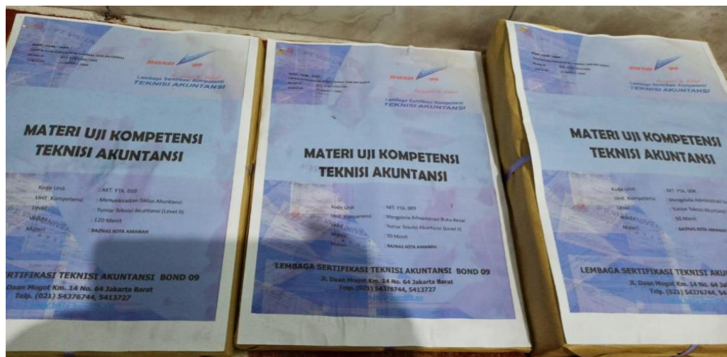
Gambar 6. Gambar Soal Uji Kompetensi

Sebelum kegiatan dilakukan, penyusunan laporan keuangan pada mayoritas BAZNAS Kabupaten/Kota di Jambi dilakukan secara konvensional dan manual. Setelah dilakukan pelatihan dan pendampingan intensif berbasis PSAK 409, terjadi transformasi signifikan pada aspek kompetensi dan sistem pelaporan. Berikut ditampilkan perbandingan kondisi sebelum dan sesudah kegiatan secara eksplisit.