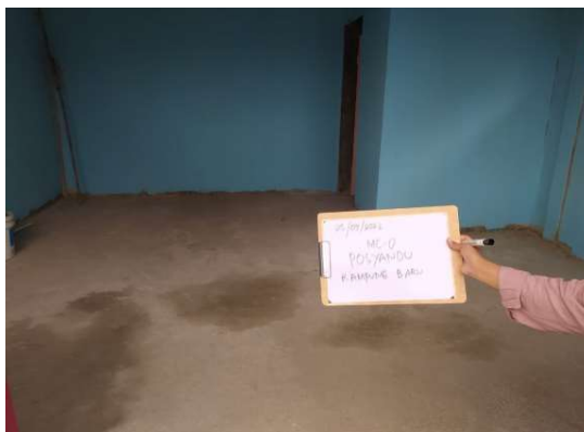
Gambar 1. Kondisi Eksisting Lantai Posyandu Mekar Kuntum Bau Semerbak