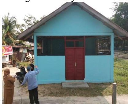
Gambar 3. Eksisting Bagian Luar Posyandu Mekar Kuntum Bau Semerbak