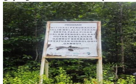
Gambar 1 Hutan Mangrove

Aspek manajemen terutama perencanaan menjadi hal yang ikut mendukung pengelolaan ekowisata kedepannya. Dalam perencanaan ini untuk menentukan rencana strategis dan operasional