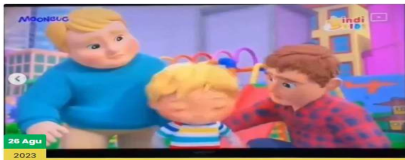
Tangkapan layar - film kartun anak-anak diduga bernuansa LGBT beredar viral di media sos

Pada zaman digitalisasi ini tidak jarang pembelajaran juga memanfaatkan teknologi, salah satu yang paling sering digunakan yakni Komputer dan Gadget. Hal ini memiliki dampak yang baik sekaligus yang tidak baik untuk anak. Disisi lain anak akan mendapat banyak pengalaman dan wawasan yang baik dengan motivasi yang tinggi untuk mengikuti kegiatan pembelajaran, namun disamping itu anak juga berpotensi terpapar pada konten negative yang berpengaruh buruk untuk pertumbuhan dan perkembangan anak usia dini, khususnya pada perilaku penyimpangan seksualitas. Pemanfaatan alat digital tanpa pengawasan yang memadai akan memberikan kesempatan pada anak untuk terpapar konten-konten yang tidak sesuai dengan usia dan karakteristik anak usia dini seperti konten bermuatan pornografi, Napza, bahkan juga LGBT. Tayangan di media khususnya film, memiliki potensi besar untuk memengaruhi tindakan, perilaku dan gaya hidup penontonnya. Pengaruh tersebut akan lebih bertahan lama bila terpapar oleh anak usia dini. Baru-baru ini keberadaan konten Lesbian, Gay, Biseksual, dan Transgender (LGBT) dalam media di digital bebas kembali menghebohkan publik lewat tayangan anak-anak di kanal YoutubeKids. Sebagaimana pada gambar di bawah ini: