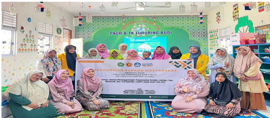
Gambar 3. Dokumentasi Kegiatan PKM

Kegiatan Pengabdian Kepada Masyarakat dengan tema Parenting: Literasi Penanggulangan Penyimpangan Perilaku Lesbian, Gay, Biseksual, Dan Transgender (LGBT) Pada Anak Usia Dini berjalan lancar dan sesuai dengan susunan kegiatan yang direncanakan sebelumnya. Tim Pengabdian telah berhasil menyampaikan materi dan melaksanakan praktik sederhana yang dapat dipahami oleh para orang tua. Selama kegiatan berlangsung, para peserta mampu mengikuti seluruh rangkaian acara dengan baik dari awal hingga akhir. Berdasarkan kuesioner yang dibagikan kepada para peserta, hasilnya menunjukkan bahwa kegiatan ini dinilai sangat berguna dan memberikan manfaat yang signifikan bagi mereka.