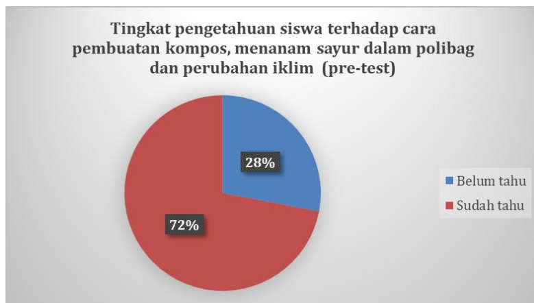
Gambar 3. Hasil Pretest

quisioner). Hasil evaluasi ini berupa peningkatan pemahaman sikap terhadap materi yang diberikan kepada para siswa SD Negeri 17 Pekanbaru. Data yang terkumpul, dikategorikan pada informasi siswa berdasarkan prosentase yang belum tahu dan % sudah tahu. Pada kuisisioner pertama yang dibagikan diperoleh hasil bahwa tingkat pemahaman siswa berkisar pada 28% belum tahu tentang cara pembuatan kompos dan cara menanam sayur di polibag. Dan sebanyak 72% siswa sudah mengetahuinya. Siswa kelas 5 SD Negeri 17 Pekanbaru tergolong siswa yang cerdas dan banyak mendapatkan informasi tentang cara pembuatan kompos dan menanam sayur di polibag. Setelah sosialisasi dan penayangan video youtube dilakukan, maka kuisisioner kedua dibagikan. Data yang dihasilkan dari kuisisioner kedua menunjukkan adanya peningkatan sebanyak 22% , yaitu hanya tersisa 6% yang belum tahu dan sebesar 94% yang sudah tahu. Dari data 6% yang belum tahu, para siswa menyatakan bahwa mereka belum mengetahui pasti tindakan, sikap dan kebiasaan apa yang harus diubah agar mampu dan siap menghadapi perubahan iklim. Besarnya pengetahuan tentang cara pembuatan kompos, cara menanam sayur di dalam polybag serta tentang perubahan iklim global pada kegiatan sosialisasi disajikan pada Gambar 3 dan Gambar 4.