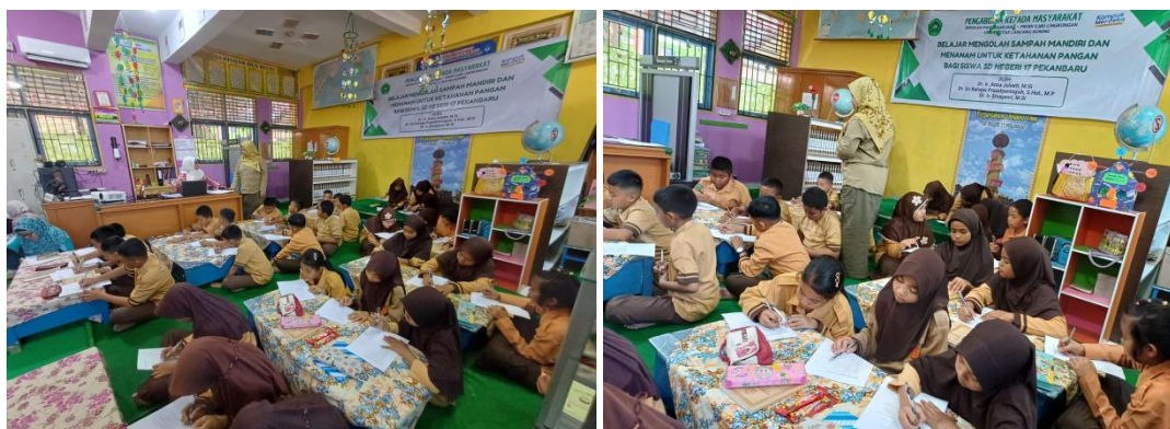
Gambar 1. Proses pengisian kuisisioner siswa SD Negeri 17 Pekanbaru

Gambar 1 menunjukkan bahwa sebelum dilakukan pengisian kuisisioner, Tim pengabdian Unilak memaparkan cara pengisian kuisisioner dengan baik. Siswa yang belum mengerti cara mengisi kuisisioner disilakan untuk bertanya kepada tim. Pengisian kuisisioner dilakukan selama \pm 20 menit.