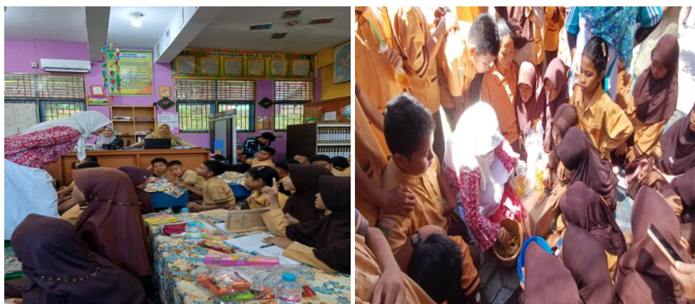
Gambar 2. Sosialisasi cara pembuatan kompos, menanam sayur di polybag bagi siswa SD dalam menghadapi perubahan iklim