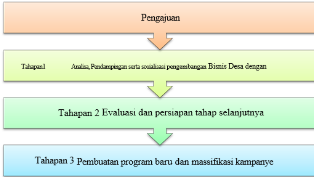
Gambar 3 Tahapan Perencanaan Program