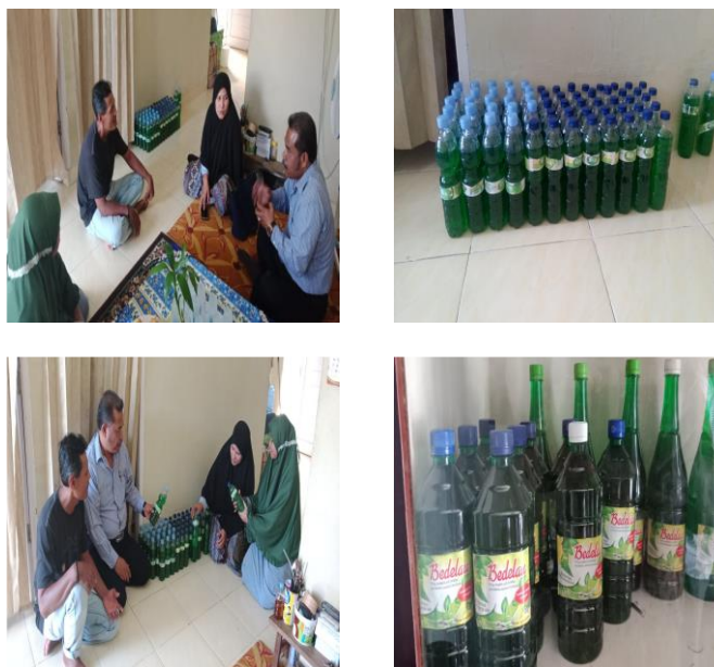
Gambar 2 Kunjungan ke Workshop Peserta Pelatihan Keterampilan Produksi Sabun Cair