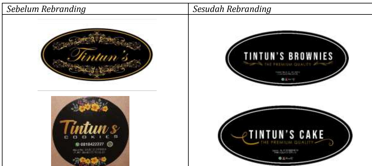
Gambar 4 Logo Sebelum dan sesudah rebranding

Untuk mempermudah konsumen mengetahui secara langsung tentang jenis dan harga produk, kami juga membuatkan kembali katalog produk yang berisi semua jenis produk dan harga setiap produk.