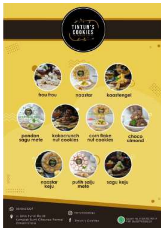
Gambar 7. Katalog