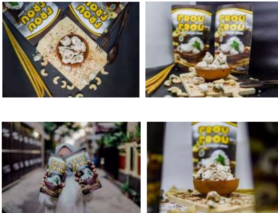
Gambar 3 Hasil Photoshoot Produk Frou Frou

Tintuns Cookies memerlukan foto produk yang menarik agar mendapat perhatian dari konsumen sehingga konsumen tergugah untuk membeli produk dari Tintuns Cookies. Sehingga tim pengemas mengambil foto yang menarik untuk ditampilkan pada media sosial Instagram. Berikut ini beberapa hasil foto dari produk Tintuns Cookies.