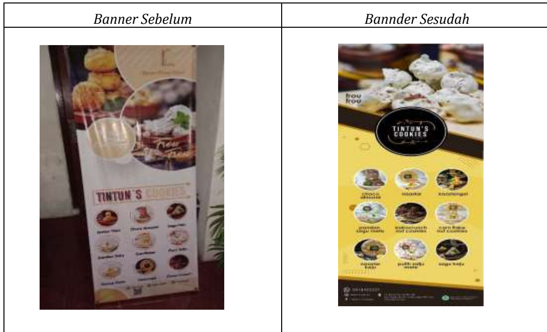
Gambar 5. Banner Sebelum dan Sesudah Rebranding

Tintuns Cookies tersebut diharapkan dapat memberikan benefit dengan semakin dikenalnya berbagai produk Tintun Cookies kepada masyarakat.