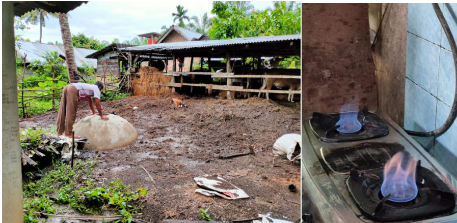
Gambar 4. Kondisi Saat Pelatihan Biogas

Berikut adalah proses pelatihan pembuatan biogas serta produk biogas yang telah dihasilkan dilihat pada Gambar dibawah ini.