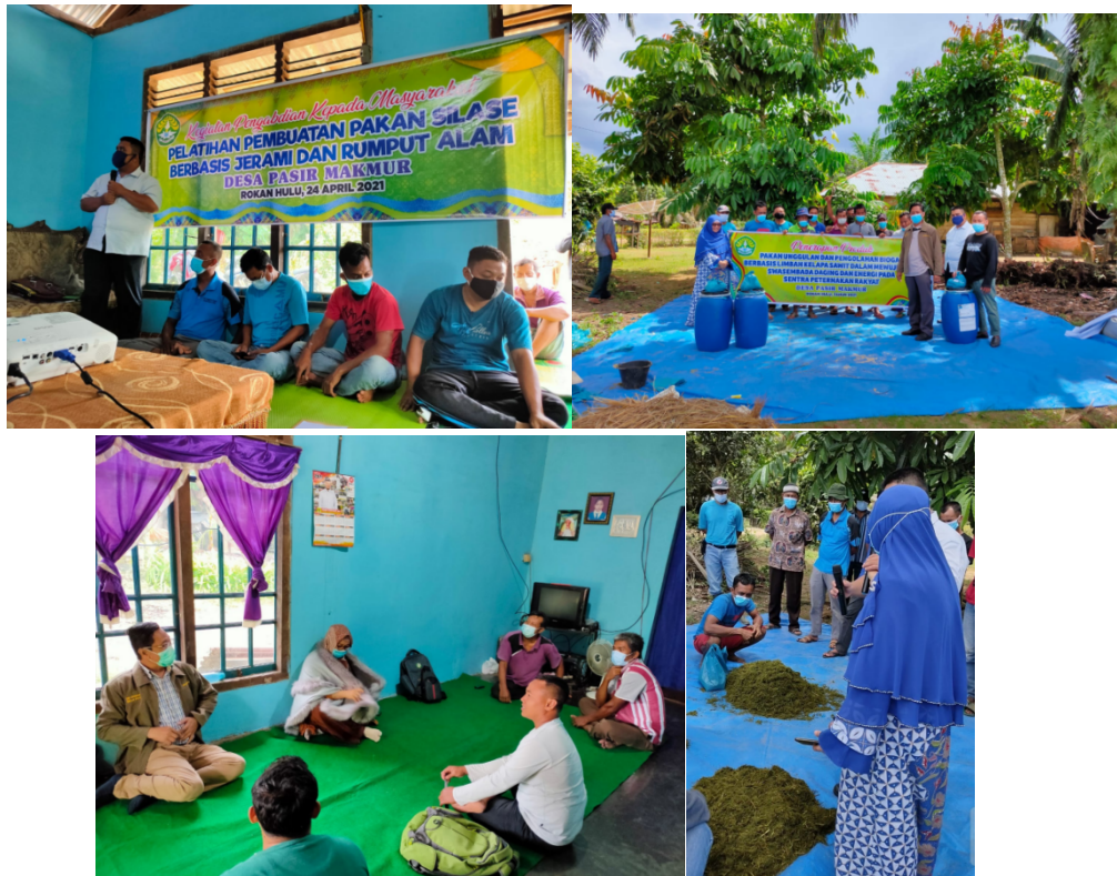
Gambar 3. Kondisi Saat Pelatihan Silase

Dari Faktor – faktor pendukung kegiatan pelatihan tersebut maka dampak langsung yang dapat dirasakan masyarakat adalah menyediakan informasi tentang peluang investasi di bidang pengolahan pakan ternak yang sangat potensial, menyediakan informasi dan pengetahuan untuk mengembangkan usaha beternak terutama pengolahan pakan silase dan biogas terutama di masyarakat sedangkan dampak tidak langsung adalah model usaha pembuatan pakan silase dan biogas yang efisien dan berkesinambungan. Adapun kondisi saat pelatihan dapat dilihat pada Gambar dibawah ini.