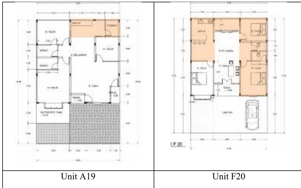
Gambar 3. Pola Perubahan Denah Pada Unit

Perhatikan pada Gambar 3 , secara keseluruhan, perubahan yang terjadi tidak menambah luasan hunian. Hal ini juga disebabkan oleh peraturan yang mengikat yaitu tidak dibenarkannya merubah fisik luar dari bangunan sehingga penghuni hanya mengubah komposisi dan kegunaan dari ruang yang mereka rasa perlu. Seperti halnya pada rumah unit A4, perubahan yang dilakukan adalah pengurangan daerah terbuka hijau berupa taman dalam yang awalnya diletakkan pada belakang bangunan kemudian ditiadakan. Ruang tidur yang awalnya berada di sebelah kiri teras kemudian dipindahkan ke sebelah kanan sehingga berdekatan dengan kamar ketiga. Perubahan selanjutnya yang dilakukan oleh penghuni adalah penambahan luasan kamar ketiga dengan mengurangi luasan dari ruang tamu dan mendekatkan kamar ketiga tersebut dengan teras luar.