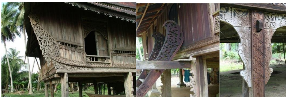
Gambar 07 Ukiran Motif pada Rumah Melayu Tradisional

Ukiran rumah Melayu tradisional juga menjadi karakter yang tidak terpisahkan. Motif ukiran umumnya merupakan interpretasi dari bentukan tumbuhan dan hewan lokal. Dibentuk dengan ukiran yang baik dan terampil (Waterson, 1997), setiap motif ukiran ini dipercaya memiliki simbol dan artian yang berbeda (Yuan, 1987), dan dapat ditemui pada hampir semua bagian rumah seperti tangga, dinding, jendela dan tiang (gambar 07).