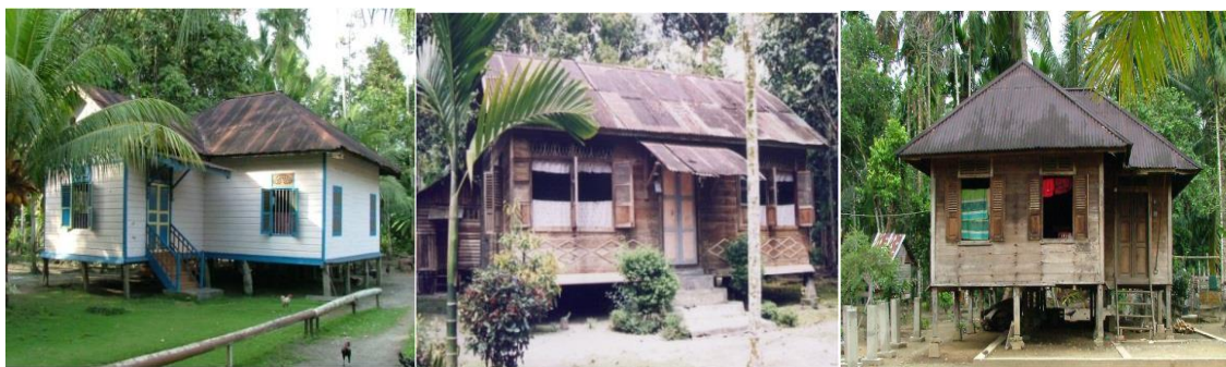
Gambar 01 Rumah Melayu Tradisional di Area Pedalaman

Kampung dapat didefinisikan sebagai permukiman yang masih mempertahankan ciri tradisionalnya dalam habitat dan wilayah yang jelas. Dalam batasan ini, kampung membentuk ‘sense of belonging’ (rasa kepemilikan) yang pada hakikatnya dibentuk oleh homogenitas dan praktik kehidupan sosial sehari-hari. Menurut Abel (2000), dalam skala kehidupan komunitas, kampung dipercaya dapat membingkai hubungan sosial antara masyarakat, bentuk fisik dan kehidupan budaya dalam satu kerangka satu keluarga besar. Lebih jauh dalam meningkatkan kehidupan berkomunitas, kehidupan sosial di kampung Melayu ditemui terintegrasi baik dengan komunitasnya yang ditandai dengan tingkat keakraban antar masyarakatnya, dan menghindari eksklusifitas individu (Yuan, 1987; Milner, 2009) (gambar 02). Pada akhirnya, setiap kampung dapat menumbuhkembangkan ciri khas, tradisi, personality and adatnya masing-masing (Milner, 2009).