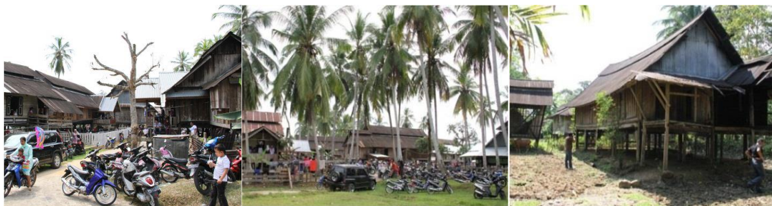
Gambar 03 Kelompok Rumah Tradisional Melayu di Koto

Tidak hanya menegakkan kekuasaan informal, Koto juga tempat memiliki rumah-rumah Melayu tradisional yang masih dijaga dan dipelihara. Setiap rumah di Koto merupakan representasi dari sebuah suku; pecahan kebudayaan. Rumah-rumah ini juga menjadi fundamen penting baik bagi suku, mau pun bagi keturunan dari suku tersebut. Lebih jauh untuk saat ini, karakter dan elemen rumah tua ini menjadi acuan dalam mengembangkan arsitektur lokal yang sudah tentu semakin memperkaya kosa kata arsitektur Melayu secara umum (gambar 03).