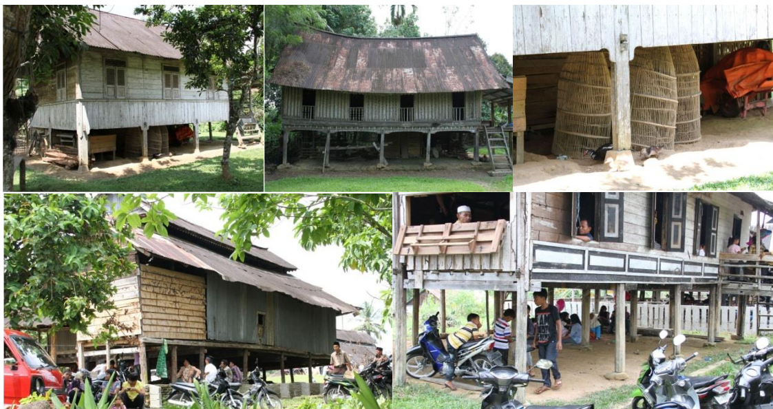
Gambar 05 Multifungsi Kegunaan Ruang antara Lantai dan Tanah

Selain konstruksi panggung, rumah Melayu juga dicirikan dengan bentukan atapnya. Atap rumah Melayu secara garis besar digambarkan sebagai atap pelana atau dikenal dengan bentukan huruf A, dan ditutupi dengan singap (gable-wall) pada kedua ujung atap. Variasi bentukan atap dapat berbeda antara kawasan Melayu (Watson and Bentley, 2007). Pada atap, terdapat juga perpanjangan elemen atap yang