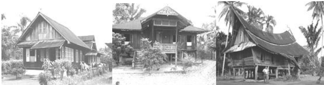
Gambar 06 Bentuk Dasar Atap Rumah Melayu Tradisional

menjulung keluar dari atap yang dikenal sebagai gable-horns, atau di beberapa tempat dikenal dengan selembayung. Gable-horn ini dapat menyerupai bagian binatang ataupun bentukanukiran yang dipercaya membawa pesan arti tertentu seperti perlindungan, kesehatan, pengorbanan, dan pertanda peringkat status sosial dalam kemasyarakatan (Waterson, 1997). Secara geometris, atap rumah Melayu tradisional umumnya ditemukan berbentuk persegi empat. Bentuk ini dikelompokkan menjadi tiga yaitu: (1) atap belah bubung atau rabung Melayu/lipat kajang/lipat pandan/atap labu/atap layar/atap bersayap/atap bertinggam; (2) atap limas atau limas penuh/limas berabung; dan (3) atap lontik atau pencalang/lancang/gorai (Wahyuningsih and Abu, 1986) (gambar 6).