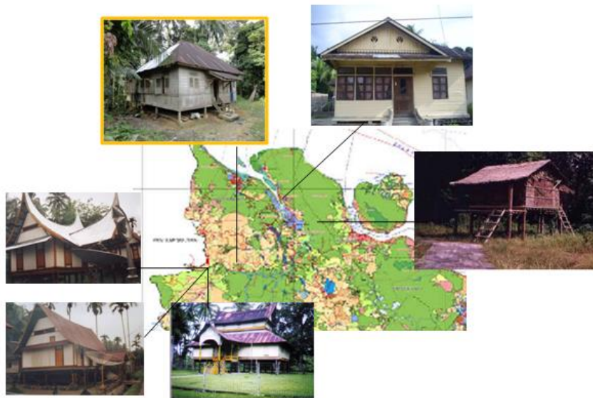
Gambar 3. Peta rumah adat Daerah sungai rokan provinsi Riau