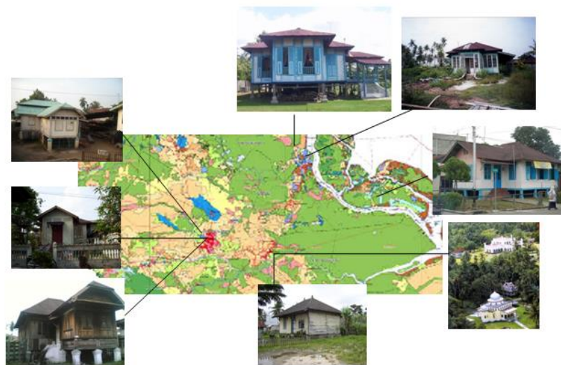
Gambar 4. Peta rumah adat Daerah sungai siak provinsi Riau