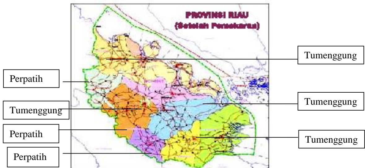
Gambar 2. Peta adat Daerah Riau.

Hasil pengamatan di lapangan terlihat tipologi bentuk arsitektur yang khas berdasarkan peta adat yang dibuat diatas. Adapun bentuk-bentuk tersebut dapat dikelompokkan berdasarkan adat dan lokasinya adalah :