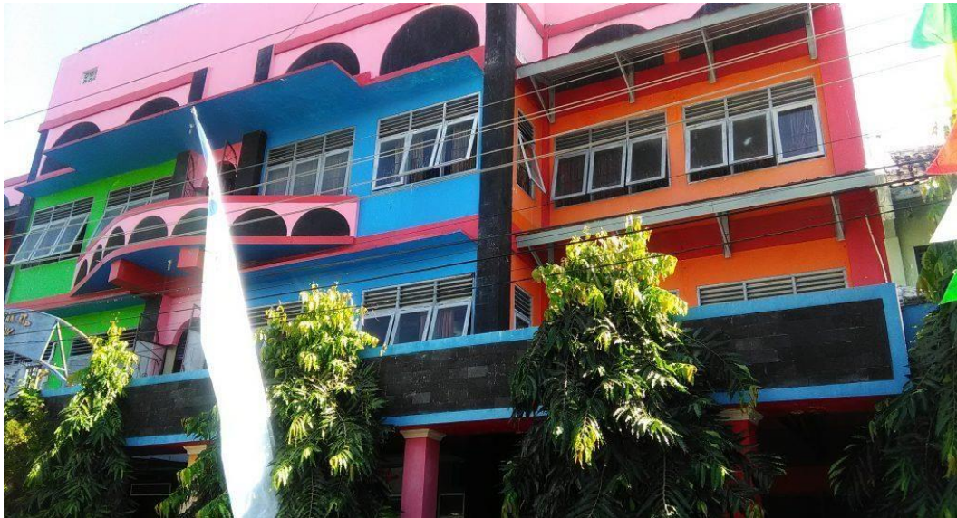
Gambar 1 SD Muhammadiyah Sagan Yogyakarta

Seyogyanya pembelajaran dilaksanakan dengan cara tatap muka, dimana 100% konsentrasi guru terhadap kondisi kelas akan mempengaruhi transfer ilmu yang maksimal, dikarenakan tumbuh kembang anak memiliki karakter masing-masing yang tidak bisa di samakan sekaligus. Pembelajaran tingkat Sekolah dasar dituntut maksimal karena sebagai bekal ilmu untuk melangkah ke jenjang pembelajaran yang lebih tinggi lagi di SMP dan seterusnya.