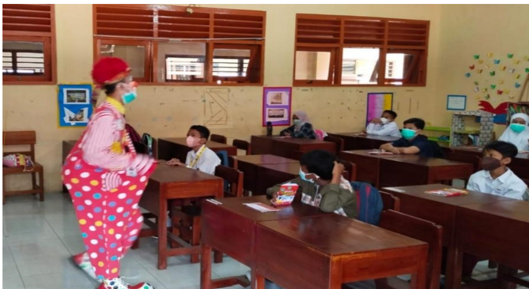
Gambar 3 SD Muhammadiyah Sagan Yogyakarta

PTM Atau sering disebut dengan pembelajaran tatap muka, beberapa saat yang lalu telah dimulai dengan segala kondisi dan keadaan yang diciptakan menunjang semangat belajar anak didik kembali ke sekolah telah dilakukan maksimal oleh pihak sekolah, namun dalam implementasinya adaptasi dalam 2 tahun daring menjadi luring memerlukan proses yang perlu dijalani bersama, yaitu pihak sekolah, keluarga, dan peneliti agar dapat segera memberikan solusi dari permasalahan yang diteliti.