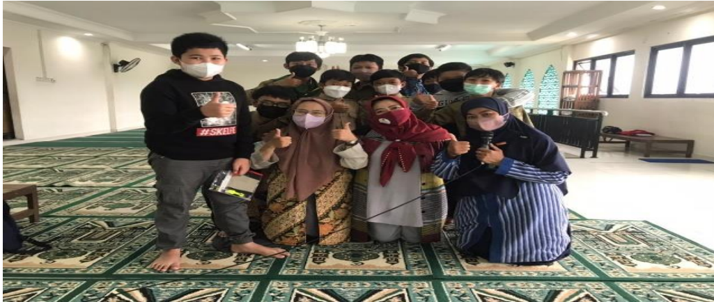
Gambar 4 Foto bersama sebagian kecil siswa beserta salah seorang guru