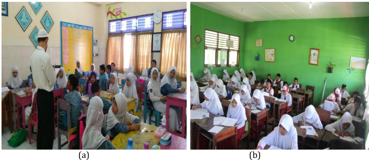
Gambar 2 (a) (b) SD Muhammadiyah Sagan Yogyakarta

Seyogyanya pembelajaran dilaksanakan dengan cara tatap muka, dimana 100% konsentrasi guru terhadap kondisi kelas akan mempengaruhi transfer ilmu yang maksimal, dikarenakan tumbuh kembang anak memiliki karakter masing-masing yang tidak bisa di samakan sekaligus. Pembelajaran tingkat Sekolah dasar dituntut maksimal karena sebagai bekal ilmu untuk melangkah ke jenjang pembelajaran yang lebih tinggi lagi di SMP dan seterusnya.