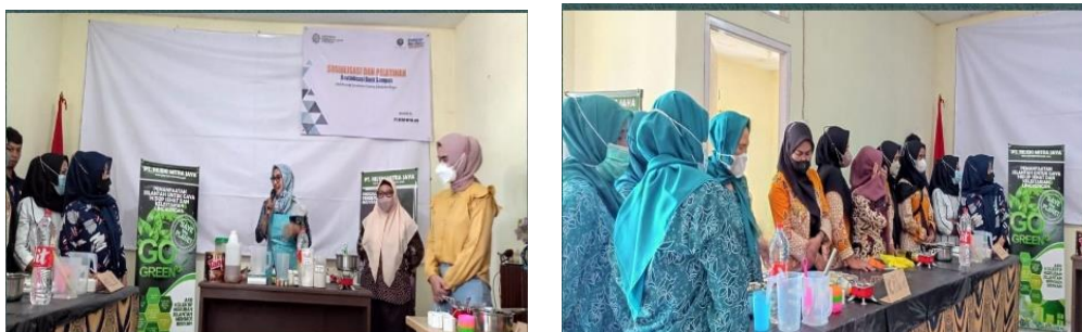
Gambar 2. Sosialisasi pemanfaatan minyak jelantah

Sebagai limbah, minyak jelantah dapat berdampak buruk bagi lingkungan apabila dibuang sembarangan, diantaranya dapat menyumbat pipa pembuangan, mencemari air tanah, dan merusak unsur hara bagi tanah.