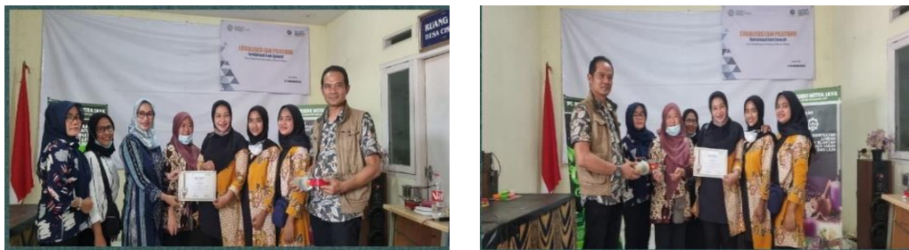
Gambar 1. Mediasi antara Desa Ciseeng dan PT RMJ

Pelatihan pengolahan minyak jelantah yang dilaksanakan di desa Ciseeng merupakan sebuah upaya untuk memotivasi masyarakatnya untuk berwirausaha. Minyak jelantah akan diolah menjadi sabun dan lilin yang bernilai ekonomis. Pelatihan dilaksanakan dengan tiga tahapan. Tahap pertama adalah mediasi dengan PT RMJ. Mediasi ini dilakukan untuk menjembatani antara Pemerintah Desa Ciseeng dengan PT RMJ untuk dijalin sebuah Kerjasama dalam bidang pengelolaan limbah minyak jelantah. Selain menjalin kerjasama PT RMJ juga menjadi fasilitator dalam pelatihan pengolahan minyak jelantah