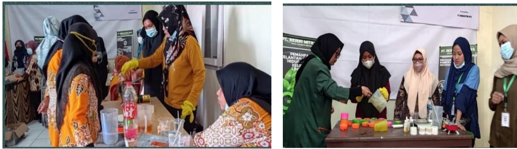
Gambar 3. Praktik pembuatan sabun dan lilin

Selama pelaksanaan pelatihan, kegiatan berjalan dengan lancar dan kondusif. Antusiasme ibu-ibu PKK juga tinggi dengan melihat hasil sabun dan lilin yang telah dibuat. Tentunya ini akan memberikan dampak yang positif serta dapat meningkatkan kepercayaan diri masyarakat untuk berwirausaha dengan produk hasil olahan minyak jelantah.