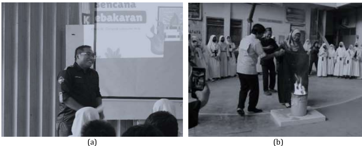
Gambar 2. Kegiatan Sosialisasi Mitigasi Bencana Kebakaran. (a) Kegiatan Pemberian Materi. (b) Kegiatan Simulasi Pemadaman Api

Selanjutnya setelah kegiatan sosialisasi selesai, seluruh siswa yang menjadi responden dalam kegiatan hilirisasi penelitian ini ini melakukan masuk kembali kedalam kelas untuk melakukan kegiatan Post-Test. Kegiatan Post Test ini dilakukan dengan tujuan untuk dapat mengetahui apakah terdapat peningkatan pengetahuan pada siswa mengenai mitigasi bencana