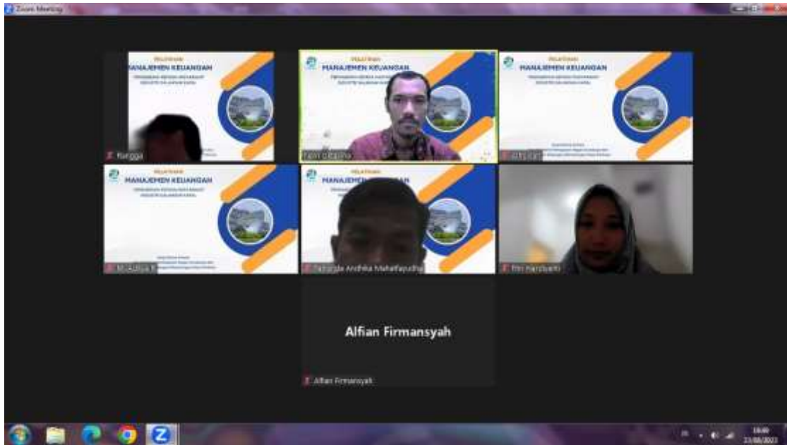
Gambar 1. Sambutan Ketua Tim Pengabdian Kepada Masyarakat