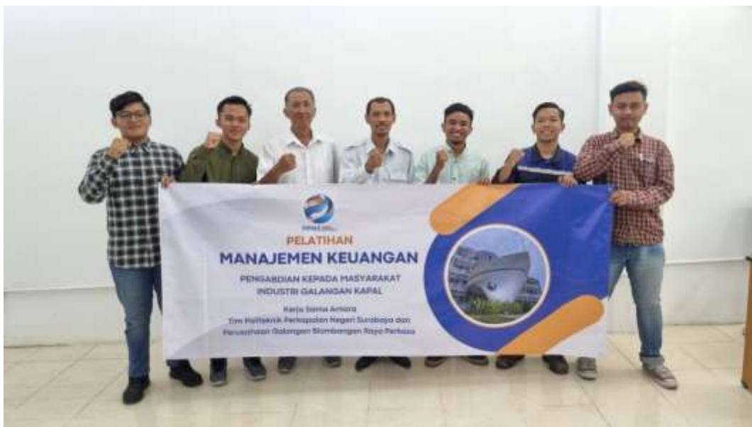
Gambar 4. Foto bersama Ketua Tim, salah satu pemateri dan Peserta

Di atas merupakan dokumentasi dilaksanakannya pelatihan secara luring yang telah terlaksana. Nampak salah satu anggota tim pengabdian kepada masyarakat politeknik perkapalan negeri surabaya sedang memberika materi. Pada kegiatan tersebut Ir. Gaguk Suhardjito, M.M. sebagai salah satu ahli manajemen keuangan tengah memberikan paparan materi mengenai materi manajemen keuangan. Sedikit cerita mengenai latar belakang peserta memang terdapat salah satu lulusan dari politeknik perkapalan negeri surabaya sementara peserta lain merupakan lulusan dari perguruan tinggi di banyuwangi. Perusahaan galangan kapal Blambangan Raya Perkasa sebenarnya juga memiliki karyawan wanita, namun memang perusahaan mempertimbangkan tingkat fleksibilitas seperti paparan yang telah disampaikan sehingga di perusahaan saat ini lebih dominan karyawan pria dibanding wanita. Selanjutnya merupakan dokumentasi kebersamaan diakhir kegiatan bersama peserta dan pemateri pelatihan.