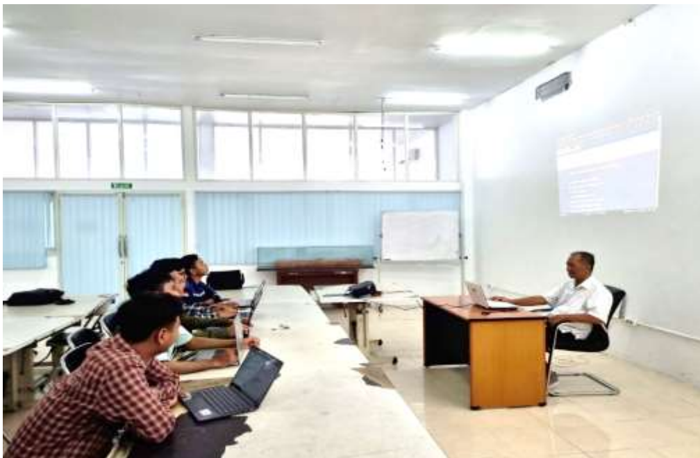
Gambar 3. Penyampaian materi oleh anggota Tim

Wawancara dilakukan secara bergantian dengan para peserta, tim berusaha mengkonfirmasi kesesuaian isi kuesioner dengan kenyataan yang mereka rasakan selama mengikuti pelatihan. Guna meminimalisir terjadinya salah persepsi pada para peserta, tim pengabdian kepada masyarakat politeknik perkapalan Negeri Surabaya telah menyampaikan bahwa pelatihan yang dilaksanakan tidak ada hubungannya dengan karir/ kontrak kerja para peserta dalam pekerjaannya di perusahaan. Tim pengabdian kepada masyarakat Politeknik Perkapalan Negeri Surabaya juga mengulang menyampaikan bahwa pelaksanaan pelatihan merupakan implementasi pengabdian kepada masyarakat. Dengan memberikan pemahaman tersebut diharapkan para peserta pelatihan dapat menyampaikan dengan sesungguhnya apa yang dirasakan selama mengikuti kegiatan pelatihan. Hasil dari Wawancara menunjukkan bahwa para peserta secara tidak langsung semuanya menyatakan bahwa apa yang mereka isikan dalam kuesioner adalah benar adanya.