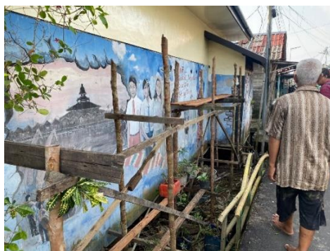
Gambar 5. Pemasangan Perancah

Tahap persiapan berikutnya yaitu proses pengecatan cat dasar pada dinding. Tim PKM melakukan cat awal berwarna abu-abu gelap, yang bertujuan untuk menutupi lukisan sebelumnya. Tampilan dinding setelah dilakukan cat dasar pada gambar 6. Cat dasar ini juga mempermudah membuat outline desain.