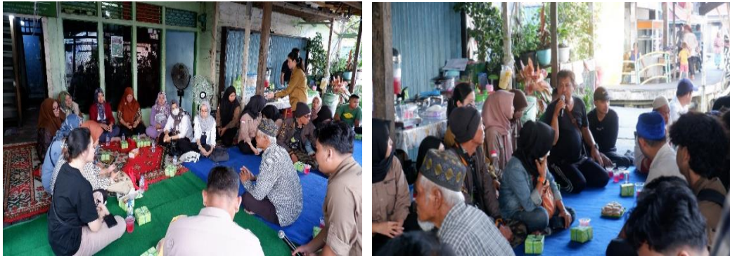
Gambar 8. Partisipan yang Hadir pada Kegiatan Sosialisasi

RW 011, Bapak Lurah Dalam Bugis, Bapak Camat Pontianak Timur, Seniman, Bhabinkamtibmas Kelurahan Dalam Bugis, dosen, dan perwakilan mahasiswa Perencanaan Wilayah dan Kota, Fakultas Teknik, Universitas Tanjungpura. Pelaksanaan kegiatan dapat dilihat pada gambar 7.