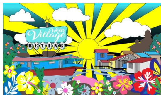
Gambar 3. Desain Mural

Ide-ide dan gagasan desain mural yang harmonis menggunakan visual dipadukan dengan warna yang menarik (Cahyanto et al., 2020; Pamungkas & Suryanti, 2023; Riski & Heldi, 2020) Desain ini yang nantinya diharapkan sebagai daya tarik kawasan, dan memperindah lingkungan sekitarnya (Fransberg et al., 2023; Zuhri et al., 2022). Berdasarkan hasil diskusi konsep desain lukisan bertema retro dan colourfull . Desain juga menampilkan citra Kampung Beting sebagai Kampung Kota di tepian Sungai dapat dilihat pada gambar 3. Desain yang digunakan adalah Water Village Beting. Setelah ditentukan desain untuk mural, tahap berikutnya adalah membahas tentang waktu pelaksanaan dan kebutuhan alat dan bahan.