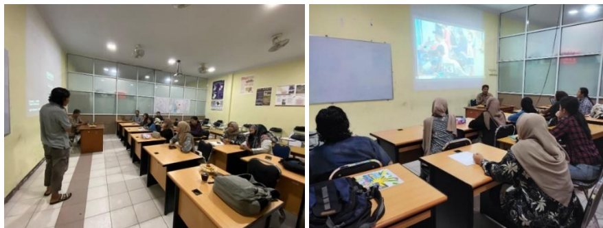
Gambar 2. Tahap Persiapan Brainstorming

Tahap awal dari persiapan pembuatan visual street art dalam bentuk mural adalah Brainstorming . Pada tahap ini menjadi pertemuan awal antara mitra dengan pelaksana PKM dapat dilihat pada gambar 1. Tahap ini bertujuan untuk mengumpulkan ide-ide dan gagasan terkait bentuk desain yang akan ditampilkan pada visual street art .