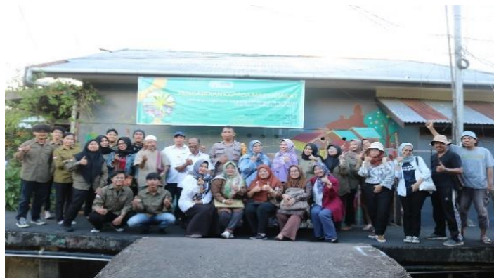
Gambar 9. Dokumentasi Mural Kegiatan PKM

Kegiatan PKM dilanjutkan dengan diskusi dengan warga sekitar terkait perbaikan lingkungan. Kegiatan PKM ini juga diharapkan dapat membantu mengembangkan Kampung Beting menjadi Kampung Pariwisata yang harapannya dapat berkembang dan dikenal dengan kegiatan street art . Selanjutnya, dilakukan dokumentasi lokasi visual street art sekaligus menutup kegiatan PKM dapat dilihat pada gambar 8.