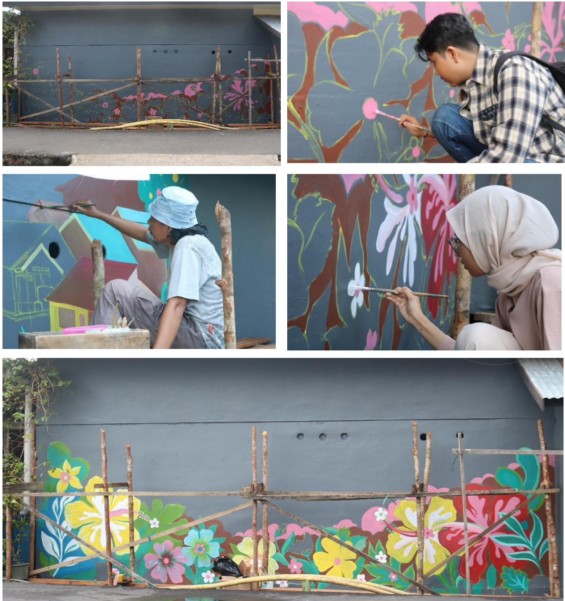
Gambar 7. Proses Melukis

Proses pelukisan dimulai dengan menggambar pola pada elemen bunga yang dilanjutkan dengan diberi warna. Proses ini berlanjut sampai dengan proses pelukisan selesai. Dalam tahapan pengerjaannya, dilakukan oleh tim pelukis dan turut dibantu oleh mahasiswa. proses pengerjaan mural dapat dilihat pada gambar 7.