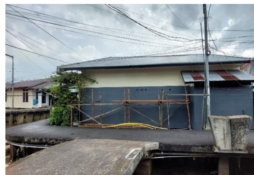
Gambar 6. Pemasangan Perancah