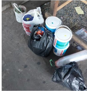
Gambar 4. Alat dan Bahan Melukis

Tahap berikutnya adalah mempersiapkan alat dan bahan yang diperlukan untuk melukis dapat dilihat pada gambar 4. Peralatan yang diperlukan untuk visual street art dinding warga, yaitu: cat air, cat akrilik, kuas kecil, kuas besar, gelas plastik, kayu cerucuk, kayu papan, tiner , terpal, dan kuas sedang.