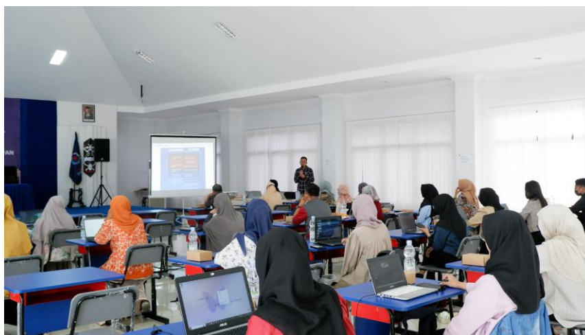
Gambar 2. Dokumentasi Hari Pertama Kegiatan

Atas dasar hal tersebut, dilakukan beberapa tahap pelaksanaan pengabdian masyarakat. Tahap persiapan diawali dengan observasi dan wawancara serta diskusi dengan mitra yang telah dilakukan. Kemudian, melalui studi kasus dan pengalaman dari tim pengabdian, menyusun materi pelatihan yang akan disampaikan. Tahap berikutnya adalah tahap pelaksanaan melalui pelatihan Klaster Penyusunan Laporan Keuangan Berbasis SAK ETAP, yang mencakup Entry Jurnal, Buku Besar dan Laporan Keuangan. Dilanjutkan dengan Klaster Pengoperasian Aplikasi Akuntansi Berbasis Komputer, yang terdiri dari pelatihan Mengoperasikan Paket Program Pengolah Angka berupa Spreadsheet dan Aplikasi Komputer Akuntansi berupa Accurate. Peserta yang mendaftar pelatihan sebanyak 47 orang dan yang hadir di dua hari pelatihan mencapai 45 orang. Berikut adalah dokumentasi kegiatan di hari pertama.