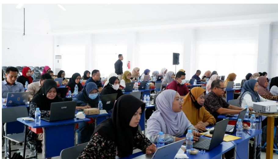
Gambar 3. Dokumentasi Hari Kedua Kegiatan

Kegiatan pelatihan di hari pertama berjalan lancar dan sesuai dengan jadwal. Pada setiap sesi penyampaian materi, peserta pelatihan antusias dan melakukan tanya jawab terkait materi yang disampaikan. Hal tersebut juga terjadi di hari kedua, yang mana di hari kedua ini praktek menggunakan aplikasi yang telah di instal pada laptop masing-masing peserta. Materi yang disampaikan tidak terlalu banyak, namun praktik pengerjaan kasus yang menjadi perhatian dalam pelatihan di hari kedua.