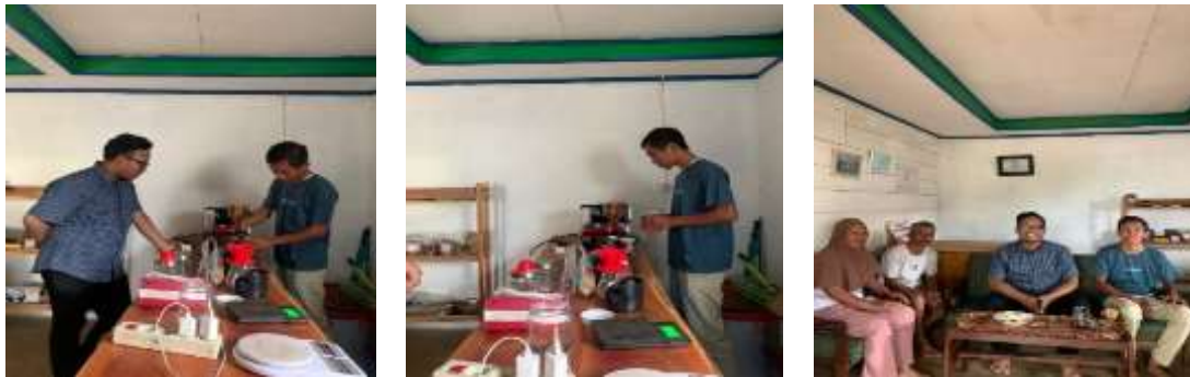
Gambar 2. Kegiatan pendampingan PTL Coffee dalam penyusunan Business Model Canvas (BMC) secara langsung di lokasi ( offline )

(BMC), dan terakhir dilakukan penutupan. Masing-masing elemen dari model bisnis BMC dijelaskan secara rinci dengan tata bahasa yang mudah dipahami, sehingga dapat dengan mudah dicerna oleh peserta Zoom Meeting . Selama kegiatan berlangsung, peserta cukup antusias dalam menyimak dan mendengarkan. Terbukti tidak ada peserta yang meninggalkan forum selama zoom meeting berlangsung. Ketika memasuki sesi diskusi, aktivitas tanya jawab mengalir dengan baik, sehingga diskusi dapat benar-benar berlangsung secara dua arah. Pengelola PTL Coffee mengaku sangat merasa terbantu dengan adanya pemaparan model bisnis dari tim pengabdian masyarakat dari Universitas Andalas. Menurutnya, kegiatan ini dapat membantu usahanya agar dapat lebih berkembang.