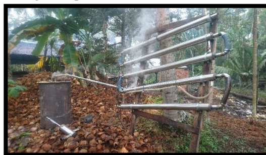
Gambar 2 Kondensor tabung paralel

Kondensor adalah alat yang digunakan untuk mengkondensasi uap atau asap hasil pembakaran sehingga berubah bentuk dari gas menjadi cair akibat penurunan temperatur, kemudian cairan yang dihasilkan disebut sebagai asap cair.