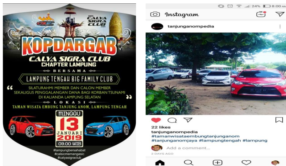
Gambar 4 Hasil sosialisasi BUMK melalui sosial media

Dalam menindak lanjuti permasalahan kurang terkenalnya objek wisata embung Tanjung Anom ini kemudian disiasati dengan menghidupkan kembali sosialisasi atau pemasaran embung Tanjung Anom melalui sosial media, selain itu pemasaran dilakukan pengelola dengan menjalin komunikasi dengan komunitas-komunitas yang berada di sekitar Lampung Tengah.