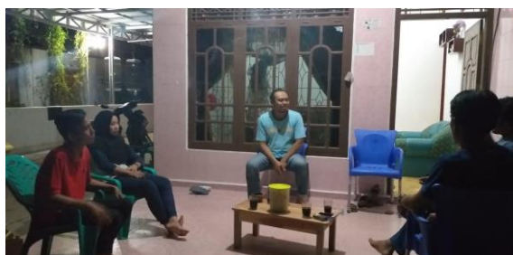
Gambar 2 Focus Group Discussion dengan pengelola BUMK

Focus Group Discussion dilaksanakan pada tanggal 30 Desember 2018 di rumah salah satu pengelola BUMK. Kegiatan FGD ini dihadiri oleh empat pengelola BUMK yang terdiri dari manager, bagian operasional lapangan, promosi, dan keuangan. Dalam kegiatan ini dilakukan diskusi untuk mendapatkan informasi tentang berbagai permasalahan yang terjadi dalam pengelolaan BUMK dan untuk mendapatkan rencana penyelesaian dan langkah nyata dalam pengembangan BUMK.