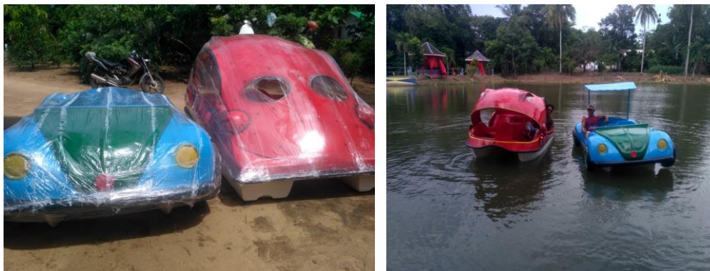
Gambar 5 Pengadaan sepeda air dengan desain baru

Hasil dari jalinan komunikasi dengan komunitas dan sosialisasi melalui media sosial, embung Tanjung Anom menjadi lokasi acara pertemuan anggota komunitas mobil “callya sigra club”. Kegiatan ini cukup semarak namun belum didukung dengan acara yang menarik para pengunjung. Selain itu, pengelola juga menambah fasilitas sepeda air dengan desain baru untuk lebih menyemarakkan embung.