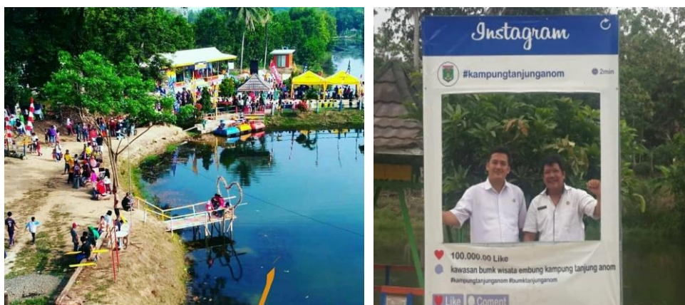
Gambar 1 Lokasi Wisata Embung Tanjung Anom

Sebagai bentuk keseriusan Pemerintah desa, memulai pemanfaatana Dana Desa, embung tanjung anom selanjutnya dipercantik hingga kondisinya siap untuk dijadikan lokasi wisata. Tak ketinggalan, beberapa fasilitas permainan air pun disediakan di embung tersebut, seperti sepeda air dan saung apung.