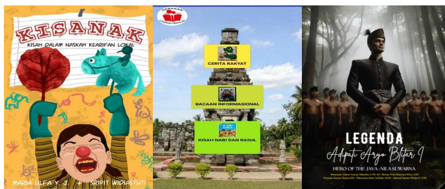
Gambar 3. Buku Kisanak , Si-Cetar , dan e-flipbook

Selain mengintegrasikan keterampilan berbahasa, model BTS juga dikembangkan dengan mengintegrasikan muatan kearifan lokal. Pengenalan budaya lokal dalam kegiatan literasi untuk anak usia dini efektif dalam memperkuat pengetahuan anak tentang budaya lokal ( Amaliyah, dkk., 2022 ). Selain itu, integrasi kearifan lokal dalam program literasi dapat meningkatkan keterlibatan dan pemahaman siswa, serta kontribusi pada pengembangan karakter dan pemahaman budaya di kalangan siswa. Selanjutnya, kegiatan literasi di SD menggunakan sastra anak berbasis kearifan lokal Blitar dapat membantu siswa mengembangkan kebiasaan membaca dan meningkatkan konsistensi dalam implementasi literasi ( Putriani, Wahyuni, dan Siyono, 2019 ). Sumber literasi berbasis kearifan lokal yang digunakan dalam PKM ini adalah buku Kisanak ; Kisah dalam Naskah Kearifan Lokal, Si-Cetar , dan e-flipbook berbasis kearifan lokal Blitar.