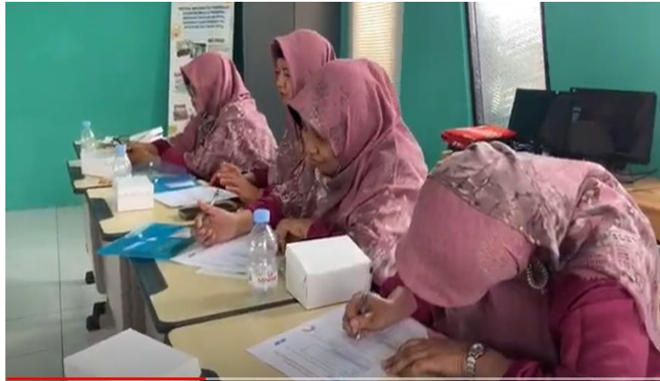
Gambar 5. Pendampingan Penyusunan Rencana Kegiatan Literasi Model BTS Berbasis Kearifan Lokal Blitar

waktu selama 30-45 menit untuk mengerjakan tugas tersebut. Tim PKM UNISBA Blitar, berkeliling untuk mendampingi guru satu per satu selama mengerjakan tugas tersebut.