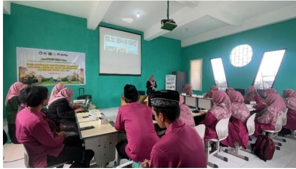
Gambar 4. Workshop Literasi Model BTS Berbasis Kearifan Lokal Blitar

Setelah sesi tanya jawab, dilanjutkan dengan FGD. FGD dilaksanakan dalam bentuk sharing session , satu per satu guru menyampaikan bentuk kegiatan literasi yang selama ini telah dilaksanakan. Guru juga menyampaikan keberhasilan dan hambatan dari kegiatan literasi tersebut. Berdasarkan hasil sharing session tersebut, keberhasilan kegiatan literasi yang telah dilaksanakan adalah sebagai berikut.