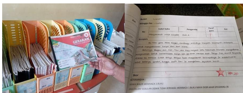
Gambar 1. Jurnal membaca siswa

SD Muhammadiyah Kota Blitar sebagai salah satu lembaga pendidikan yang peduli terhadap keterampilan literasi siswa telah melaksanakan GLS sejak tahun 2017. Berdasarkan wawancara dengan Kepala SD Muhammadiyah Kota Blitar diketahui bahwa pada tahun 2017 sampai sebelum pandemi, SD Muhammadiyah Kota Blitar telah melaksanakan GLS. GLS di sekolah tersebut dilakukan dengan menugaskan siswa untuk melakukan kegiatan membaca di perpustakaan setiap hari. Kegiatan membaca tersebut dilakukan oleh siswa saat sebelum pembelajaran, ketika istirahat, atau setelah pembelajaran. Setelah membaca, siswa diwajibkan untuk membuat ringkasan atau sinopsis hasil membaca. Sinopsis atau ringkasan tersebut ditulis ke dalam jurnal membaca yang disediakan oleh sekolah dan diletakkan di perpustakaan. Selanjutnya, jurnal akan diperiksa secara berkala oleh petugas perpustakaan.