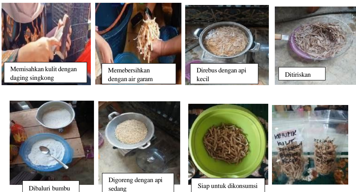
Gambar 4. Dokumentasi praktik pembuatan kripik kulit singkong dan produk kripik kulit singkong

Produk kripik kulit singkong merupakan salah satu inovasi baru yang dapat dikembangkan oleh KUB Sejahtera, oleh karena itu perlu mengetahui tingkat kesukaan konsumen sebelum dijual dan dipasarkan. Pada kegiatan pengabdian dilakukan pengujian organoleptik kripik kulit singkong untuk melihat tingkat kesukaan peserta pelatihan terhadap penggunaan tepung siap saji dan tepung racikan sendiri. Hasil pengujian organoleptik ini meliputi penilaian atribut mutu : warna, tekstur, rasa dan aroma kripik kulit singkong yang dihaikan. Hasil pengujian organoleptic kripik kulit singkong dapat dilihat pada Gambar 7.