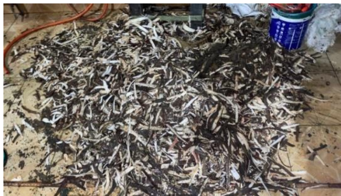
Gambar 1. Limbah kulit singkong KUB Sejahtera dalam sekali proses produksi

Untuk kegiatan satu kali proses produksi keripik singkong membutuhkan lebih kurang 40 kg ubi kayu yang menghasilkan limbah kulit ubi kayu 20% dari berat ubi kayu total atau kurang lebih 7-8 kg kulit ubi kayu. Selama ini kulit ubi kayu hanya dibuang tanpa pemanfaatan lebih lanjut (Gambar 1). Menurut Manurung (2023), permasalahan yang dihadapi oleh pelaku usaha industri rumahan di Kecamatan Tenayan Raya karena kurangnya pembinaan dari pemerintah melalui instansi terkait sehingga kurang pengetahuan dan ketrampilan dalam mengelola usahanya sehingga peningkatan kualitas dan kuantitas berjalan lambat dan peningkatan pendapatan usaha rumah tanggapun tidak signifikan. Salah satu usaha untuk menambah pendapatan adalah peningkatan produksi dan memanfaatkan limbah menjadi produk yang mempunyai nilai ekonomi seperti keripik kulit singkong. KUB Sejahtera memiliki modal yang terbatas untuk mengembangkan usaha keripik singkongnya, sehingga mengalami kesulitan untuk menerapkan teknologi terutama peralatan yang dibutuhkan dalam proses produksi keripik singkong. Selain, itu belum ada pengetahuan tentang pemanfaatan kulit singkong yang mempunyai nilai ekonomi. Hal ini menyebabkan pengembangan usaha keripik singkong tidak bertumbuh secara signifikan. Diperlukan bantuan teknologi untuk peningkatan produksi keripik singkong dan inovasi dalam pemanfaatan limbah kulit singkong menjadi produk yang mempunyai nilai ekonomi.