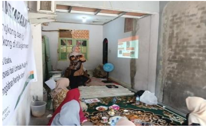
Gambar 3. Pemberian pelatihan pemanfaatan limbah kulit singkong

Kegiatan inti pengabdian yakni pelatihan dan praktik pembuatan kripik kulit singkong. Peserta pelatihan mengikuti setiap kegiatan dengan antusias, terlihat dari banyaknya pertanyaan yang diberikan oleh peserta pelatihan mengenai prosedur pembuatan kripik kulit singkong. Sebelum dan setelah dilakukan pelatihan peserta diberikan kuesioner yang memuat beberapa pertanyaan mengenai pengetahuan awal peserta tentang pemanfaatan limbah kulit singkong yang dapat diolah menjadi kripik kulit singkong. Data kuesioner dapat dilihat pada Gambar 4.