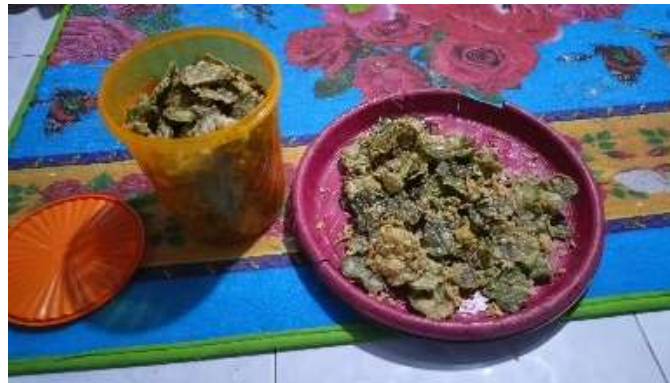
Gambar 3. Peyek waru

Pembuatan stick jeruju membutuhkan beberapa bahan antara lain daun jeruju, bawang merah, tepung terigu, tepung beras, ragi, telur, margarin, minyak goreng dan penyedap rasa. Untuk peralatan dibutuhkan blender, kompor, gas, wajan, baskom kecil/wadah, piring dan ampia. Cara pembuatan stick jeruju adalah sebagai berikut: