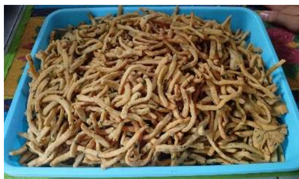
Gambar 4. Stick Jeruju

Tutorial pembuatan peyek waru dan stick jeruju ini oleh tim pengabdian kepada masyarakat telah dibuatkan dalam bentuk video dan telah diunggah di akun youtube dengan link https://www.youtube.com/watch?v=fRNisK0VAxg . Harapannya masyarakat pesisir yang berada di daerah lainnya bisa dapat memanfaatkan potensi ekosistem mangrove seperti HHBK menjadi