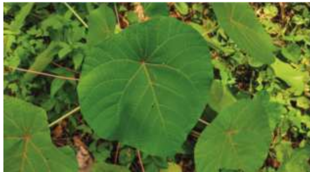
Gambar 1. Hibiscus tiliaceus /Daun Waru

Untuk bahan utamanya adalah jenis mangrove hibiscus tiliaceus , atau lebih dikenal sebagai waru, merupakan flora yang sangat adaptif dan tersebar luas di wilayah Indonesia (Singgalen, 2020). Tumbuhan ini mampu tumbuh dengan baik di berbagai habitat, terutama di daerah pesisir. Waru sering ditemukan tumbuh secara alami di hutan maupun lahan terbuka, namun juga kerap dibudidayakan sebagai tanaman hias atau peneduh. Taksonomis, waru diklasifikasikan ke dalam suku Malvaceae (Syaiful & Yuliani, 2022). Sebagian komponen tumbuhan waru, seperti daun, kayu, dan serat kulit batang, dapat digunakan untuk berbagai tujuan (Friess et al., 2019). Kayu dari tanaman waru tergolong ringan, cukup padat, memiliki tekstur halus, dan tidak terlalu keras. Beberapa pemanfaatan kayu waru meliputi bahan untuk konstruksi atau pembuatan perahu, roda kereta, pegangan alat, seni ukir, dan bahan bakar (Debrot et al., 2020).