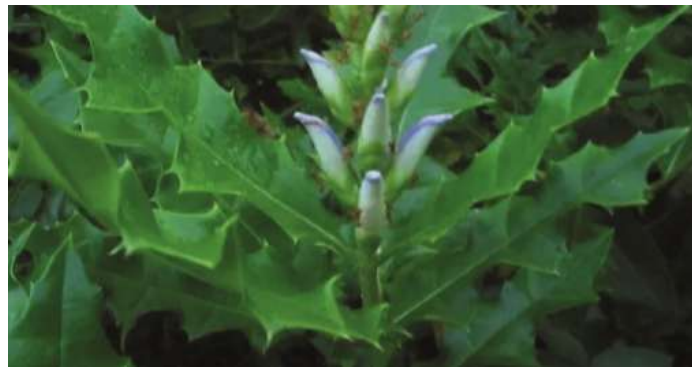
Gambar 2. Acanthus ilicifolius / Daun Jeruju

Bahan utama lainnya adalah jenis mangrove Tumbuhan jeruju ( Acanthus ilicifolius ) berasal dari keluarga Acanthaceae dan merupakan tanaman bakau yang sering ditemukan di kawasan payau yang lembab di muara sungai. Tanaman ini termasuk dalam kategori tanaman akuatik yang tumbuh di atas permukaan air (Debrot et al., 2020). Tanaman Jeruju memiliki tinggi yang tidak terlalu tinggi, sekitar 2 meter, dan tumbuh di permukaan tanah. Kayunya kuat dan bercabang tegak serta ramping, tergantung pada usia tanaman. Cabang-cabangnya terdapat pada bagian yang lebih tua dan jumlahnya tidak banyak. Tanaman ini juga memiliki akar udara yang terletak di bawah permukaan batang yang horizontal (Pin et al., 2021).