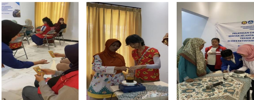
Gambar 6. Kegiatan aplikasi pemurnian minyak jelantah menggunakan kunyit

Pada pelatihan pemurnian minyak jelantah, peserta dibagi kedalam 4 kelompok kecil untuk memudahkan dalam proses diskusi serta penyerapan materi. Proses pemurnian minyak jelantah dilakukan dengan cara memanaskan minyak jelantah hingga mendidih, lalu ditambahkan 10 gram kunyit, kemudian diaduk selama 60 menit. Setelah itu didinginkan, lalu disaring agar kunyit dan endapan minyak tidak masuk kedalam larutan minyak hasil pemurnian. Kunyit bertindak sebagai biosorben yang dapat menyerap senyawa karsinogenik yang ada di dalam minyak. Keseluruhan proses kegiatan pelatihan tersebut disajikan dalam Gambar 6. Peserta pun juga diberikan serbuk kunyit untuk dibawa pulang dan diharapkan dapat melakukan praktik mandiri di rumah.