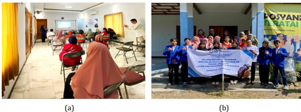
Gambar 3. Kegiatan Penyuluhan Bahaya Minyak Jelantah (a) Pemaparan materi bahaya minyak jelantah; (b) Foto bersama warga

Kegiatan pelatihan diawali dengan melakukan penyuluhan seperti yang disajikan pada Gambar 3. Penyuluhan merupakan salah satu metode efektif untuk meningkatkan pengetahuan dan informasi kepada masyarakat. Penyuluhan kesehatan merupakan salah satu upaya untuk menyampaikan pesan kepada masyarakat agar mengetahui dan melakukan suatu anjuran yang dapat membantu mencegah kerusakan lingkungan dan timbulnya penyakit (Sumarni et al., 2020). Pada kegiatan penyuluhan ini juga diberikan booklet dan handout Powerpoint (PPT) sebagai media visual.