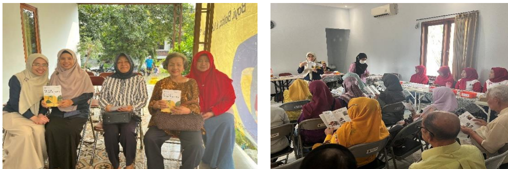
Gambar 4. Pembagian booklet kepada warga RW 04 Ketintang

Berdasar hasil penelitian yang dilakukan oleh Marbun & Hutapea, (2022) kegiatan penyuluhan dan disertai dengan pemberian media visual, seperti booklet dan handout PPT ini efektif dalam meningkatkan pengetahuan masyarakat sebelum dan sesudah dilakukan penyuluhan (Gambar 4). Pemberian media visual ini membuat masyarakat menjadi antusias, aktif menyampaikan pertanyaan, aktif memberikan jawaban dari pertanyaan yang diberikan, dan perhatian terhadap setiap informasi yang disampaikan selama kegiatan penyuluhan berlangsung. Hal tersebut sesuai dengan kegiatan pengabdian yang dilakukan oleh (Rehena & Nendissa, 2021) dimana pemberian media visual dapat meningkatkan antusiasme masyarakat dan perhatian terhadap materi yang diberikan.