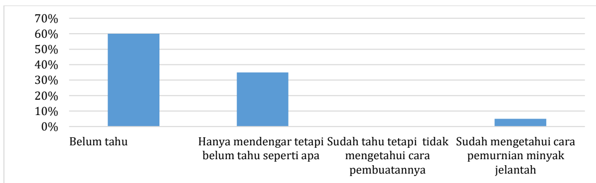
Gambar 2. Data mitra mengenai pengetahuan dasar terkait cara pemurnian minyak jelantah menggunakan biosorben kunyit

Berdasar hasil pretest, pengetahuan mitra terkait minyak jelantah adalah 67%. Hal tersebut menunjukkan bahwa kemampuan dasar peserta berada pada kategori cukup dengan sebagian besar peserta belum mencapai skor maksimal. Sebagian besar peserta telah mengetahui definisi dari minyak jelantah. Para peserta pun juga telah memahami bahwa minyak jelantah mengandung senyawa berbahaya seperti radikal bebas dan karsinogen. Akan tetapi, ketika ditanyakan terkait indikator kelayakan minyak, hanya 45% warga yang dapat menjawab dengan benar. Begitu juga ketika ditanyakan terkait teknik untuk mengurangi kandungan racun dalam minyak jelantah dan cara pemurnian minyak jelantah, sebagian besar warga (95%) belum mengetahui bagaimana cara melakukannya (Gambar 2). Oleh karena itu, perlu dilakukan kegiatan penyuluhan dan pelatihan pemurnian minyak jelantah ini agar dapat meningkatkan kephahaman responden terkait teknik adsorpsi menggunakan biosorben kunyit.