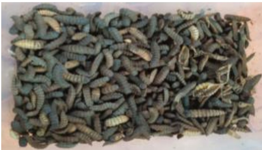
Gambar. 1 Maggot BSF

Untuk menekan biaya pakan, maka dilakukan berbagai riset yang bertujuan mencari pakan alternatif yang mudah di produksi, harga terjangkau, berkelanjutan dan ramah lingkungan. Salah satu pakan alternatif yang dapat digunakan adalah pakan alami maggot BSF ( Putri, dkk 2012 ; Ginting et al., 2022 ). Maggot yang dibudidayakan dapat digunakan sebagai sumber protein hewani. Selama ini, beberapa peternak sudah memanfaatkan maggot sebagai pakan ayam, namun menemui kendala dalam budidayanya ( Sanawati et al., 2025 ).