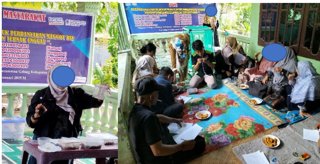
Gambar. 3 Edukasi dan Pelatihan Maggot BSF

Berdasarkan observasi dilapangan dan hasil diskusi dengan peternak unggas, permasalahan mitra antara lain tingginya biaya produksi akibat mahalnya harga pakan dan ini sangat berpengaruh pada perkembangan usaha ternak unggas. Sementara mitra belum maksimal memanfaatkan potensi sumber daya yang ada yaitu sampah organik yang selama ini hanya menambah masalah lingkungan dengan bau yang tidak sedap dan berpotensi menjadi sumber penyakit. Disisi lain Mitra belum mampu menerapkan teknologi budidaya maggot Black Soldier Fly (BSF) sebagai pakan alternatif unggas yang berbiaya rendah, bergizi tinggi, dan ramah lingkungan dengan memanfaatkan sampah organik rumah tangga sebagai media pakan bagi maggot untuk tumbuh dan berkembang. Tahap selanjutnya mengedukasi mitra dengan memberikan pengetahuan tentang potensi maggot sebagai pakan yang tinggi protein dengan biaya yang murah dan pemanfaatan sampah organik dalam mendukung pembangunan berkelanjutan. Kemudian mitra diberikan pelatihan budidaya maggot dan tahapan2nya dari mulai persiapan kandang lalat BSF sampai menghasilkan larva siap panen. Pendampingan terus dilakukan sampai mitra mampu melaksanakannya secara mandiri dan berkelanjutan. Edukasi kepada mitra dapat dilihat pada gambar 3.