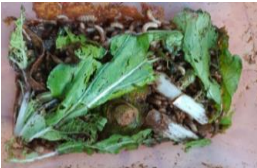
Gambar. 5 Pemberian Pakan Maggot

Pakan maggot berupa limbah sayuran dan buah atau limbah ikan dapat diberikan langsung atau dicacah halus kemudian dimasukkan kedalam biopond.