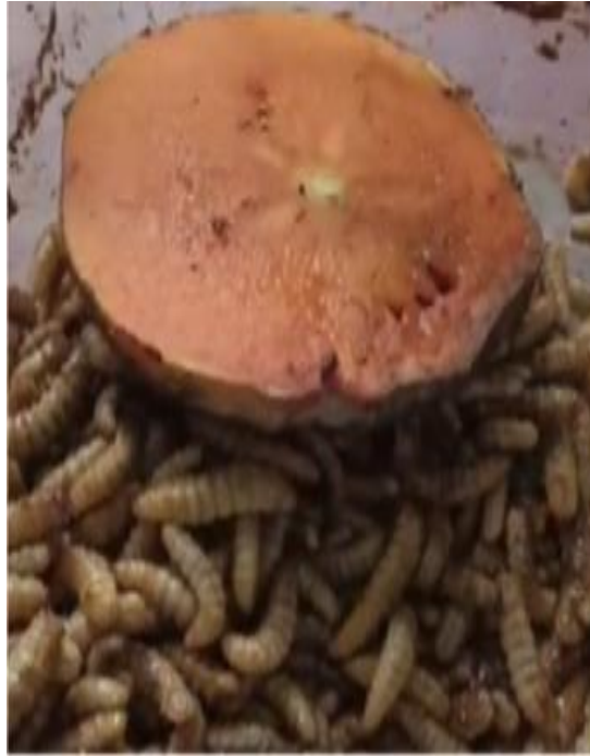
Gambar. 4 Larva Maggot BSF

Penetasan Telur Menggunakan kotak-kotak kecil atau dengan triplek sebagai media untuk maggot bertelur. Sehingga dapat memudahkan maggot untuk melakukan perkembangbiakan didalam wadah media yang telah disediakan. Semut adalah predator yang harus diwaspadai, karena bisa memakan telur2 dari lalat BSF. Untuk menghindari itu, kandang perlu dipasang net insect yang diletakkan di dinding dan langit-langit kandang atau yang dekat dengan tempat penetasan telur ( Murdowo et al., 2020 ).