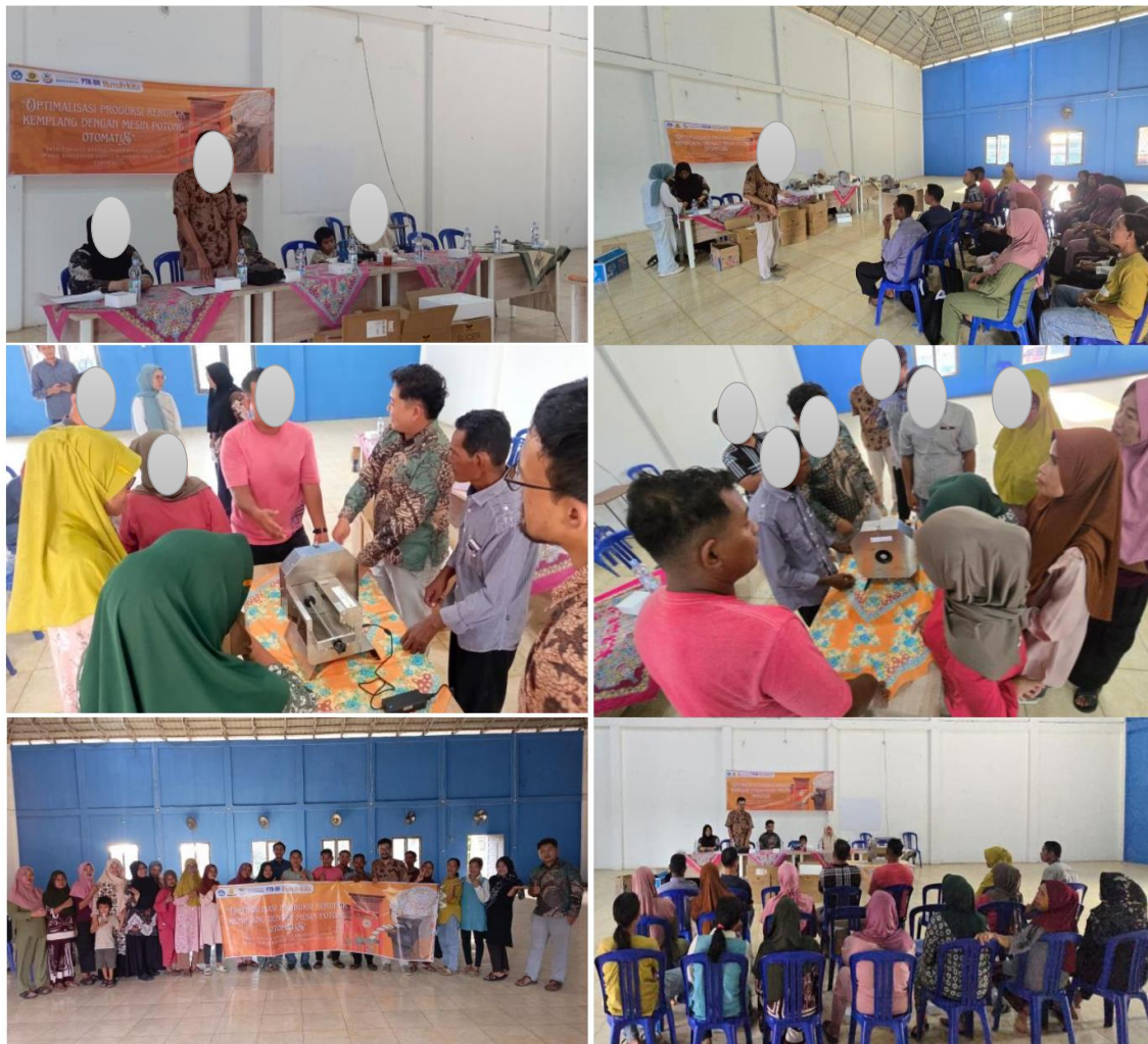
Gambar 3. Dokumentasi aktivitas pengabdian kepada masyarakat

Implementasi mesin potong otomatis menunjukkan hasil yang signifikan terhadap peningkatan efisiensi dan kualitas produksi Berdasarkan hasil observasi dan data yang dikumpulkan di lapangan, terdapat peningkatan pada beberapa aspek utama. Efisiensi dan konsistensi diukur melalui perbandingan waktu pemotongan, ketebalan irisan, volume produksi, tenaga kerja dibutuhkan dan tingkat kelelahan pekerja sebelum dan sesudah penerapan mesin potong otomatis (Tabel 1).