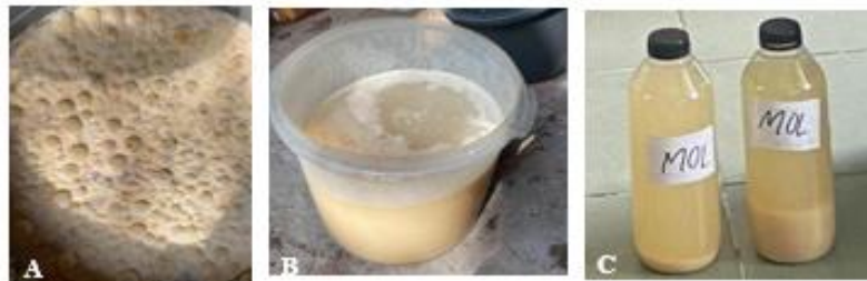
Gambar 2. MOL berbahan nasi sisa. A= proses fermentasi, B= hasil panen sudah saring, C= MOL sudah di kemas.