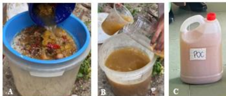
Gambar 1. POC berbahan sisa organik ruang tangga. A= proses panen dan penyaringan, B= proses kemas, C= POC siap digunakan.

Pelaksanaan kegiatan diawali dengan persiapan bahan dan pembuatan contoh POC (Gambar 1) serta mikroorganisme lokal (MOL) (Gambar 2) sebagai media pembelajaran. Kegiatan penyuluhan dan pelatihan dilaksanakan secara langsung melalui metode ceramah, demonstrasi, dan praktik. Peserta yang terlibat berjumlah 30 orang yang terdiri dari siswa, guru, dan tenaga kependidikan. Keterlibatan peserta secara aktif selama kegiatan menunjukkan bahwa metode yang digunakan sesuai dengan kebutuhan mitra.