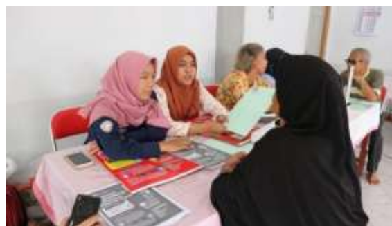
Gambar 3. Pelaksanaan kegiatan konseling hipertensi pada lansia