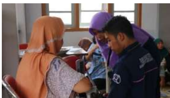
Gambar 2. Pemeriksaan tekanan darah

Selain pengukuran tekanan darah, dalam kegiatan pengabdian ini juga dilakukan konseling kesehatan tentang hipertensi melalui media poster yang digunakan sebagai media promosi kesehatannya. Kemudian para peserta diperkenalkan untuk memberikan pertanyaan terkait dengan hipertensi kepada pemateri. Tidak hanya memberikan materi saja, tetapi lansia juga diberikan leaflet untuk dibawa pulang sebagai bahan bacaan jika terlupa. Selain itu, kegiatan intervensi ini juga memberikan buah-buahan yang dapat menurunkan tekanan darah seperti buah semangka sebagai salah satu cara alami untuk menurunkan tekanan darah tanpa harus mengkonsumsi obat-obatan. Pelaksanaan kegiatan intervensi dapat dilihat pada Gambar 1 dan 2.