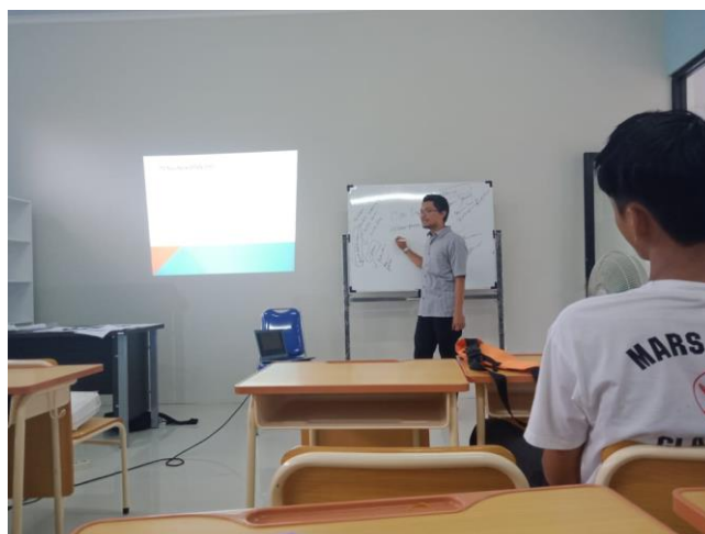
Gambar 1 proses peneraan program

Pengabdian pada masyarakat kali ini dilaksanakan sebanyak dua kali pertemuan dalam seminggu, dalam setiap sesi dilaksanakan tiga pemberian materi dengan jumlah materi yang di berikan sebanyak 14 materi, Pada kegiatan awal dilaksanakan proses pengarahan dan penjelasan tentang maksud dan tujuannya program bimbingan karir ini pada siswa kesetaraan paket C hal ini dilakukan untuk menyesuaikan kondisi kelas dan juga menjelaskan tahapan tahapan yang akan dilakukan selama program ini dilaksanakan karna dalam pendidikan nonformal dalam hal ini pendidikan kesetaraan layanan bimbingan karir ataupun layanan yang berkaitan dalam bimbingan konseling belum masuk pada ranah pendidikan nonformal (Mulyawan, 2020)