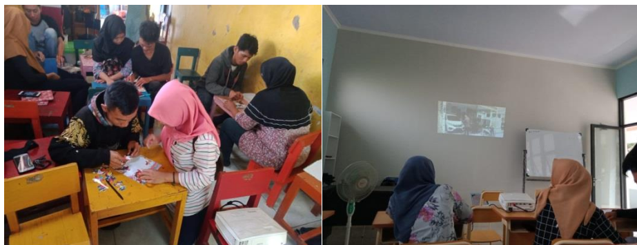
Gambar 2 penggunaan media dalam pemberian materi

Dalam pemberian materi pengabdian juga memberikan materi dengan menggunakan media yang bertujuan untuk menarik fokus dan minat pada siswa, media yang digunakan berupa media permainan berupa puzzle dan media film pendek sebagai media pemberian materi pada siswa, (Anam, 2015) penggunaan media yang menarik dalam pembelajaran dapat meningkatkan minat belajar pada siswa.