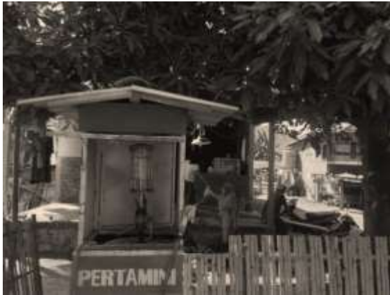
Gambar 1. Mesin pertamini