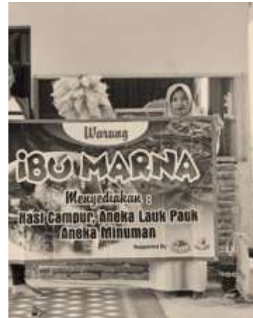
Gambar 2. Spanduk nama warung (Dok. Penulis, 2020)