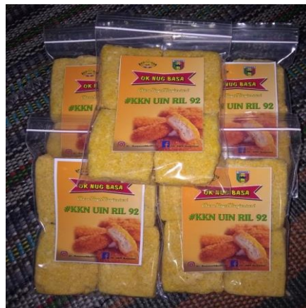
Gambar 5. Nugget Ampas Susu Kedelai

Proses pengolahan produk nugget tidak ditemukan kesulitan yang cukup berarti. Ibu-ibu PKK diharapkan dapat mempraktekan proses pengolahan ampas susu kedelai menjadi produk nugget dimana dinilai cukup banyak digemari berbagai kalangan terutama baik digunakan untuk anak-anak yang dapat dikonsumsi dengan cara penambahan bahan-bahan lain berupa sayur-sayuran. Cara ini sangat bermanfaat bagi anak-anak yang tidak suka sayuran maka dapat di inovasi dengan membuat nugget yang bahan-bahannya sangat bergiziz, seperti dapat ditambahkan sayur-sayuran, Sehingga gizi anak dapat terpenuhi. selain itu tidak menggunakan bahan-bahan kimia. Adapun gambar nugget ampas susu kedelai tercantum dalam Gambar 4.