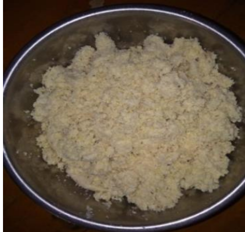
Gambar 4. Ampas Susu Kedelai