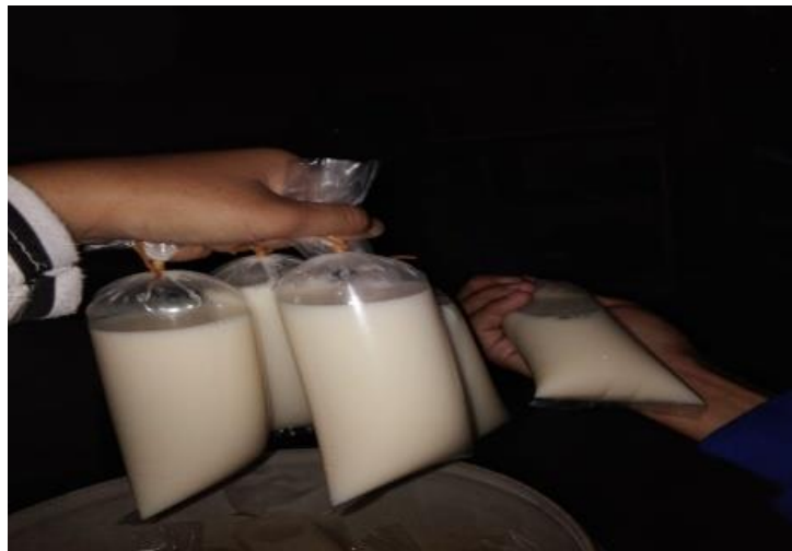
Gambar 3. Pembungkusan Susu Kedelai