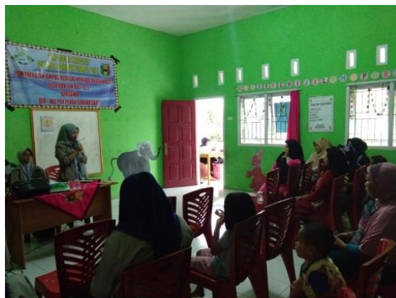
Gambar 6. Pelaksanaan Kegiatan

Setelah materi selesai diberikan, dibuka sesi tanya jawab sekaligus memperkenalkan produk nugget. Kegiatan ini dapat diketahui bahwa antusias peserta untuk memperoleh keterampilan dan kemampuan tentang pemanfaatan limbah susu kedelai sebagai bahan utama pembuatan nugget. Begitu pula ibu-ibu PKK sangat antusias mengikuti penyuluhan tersebut, dimana banyak yang melontarkan pertanyaan-pertanyaan terkait proses pembuatan nugget. Rangsangan untuk meningkatkan produk direspon dengan baik oleh peserta, sehingga memberikan harapan bagi upaya perbaikan kualitas konsumsi pangan hewani dan membuka peluang kepada ibu-ibu PKK untuk melakukan kegiatan lanjutan yang bersifat kontinuitas dan berkesinambungan sehingga ibu-ibu PKK dapat terbina.