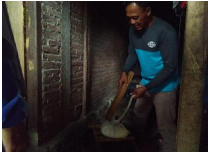
Gambar 2. Penyaringan atau Pengepresan Susu Kedelai