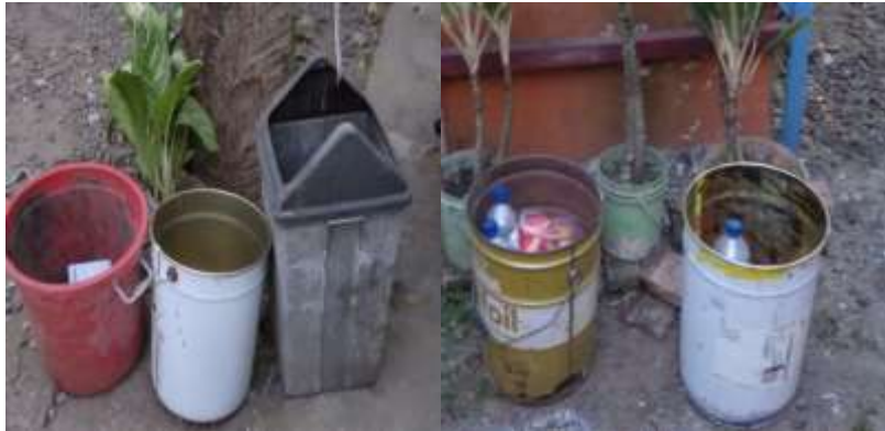
Gambar 4. Tempat sampah di kost putra Lingkungan winaya

tempat pembuangan sampah di kost putra Lingkungan Winaya seperti yang diperlihatkan Pada Gambar 4 di bawah ini.