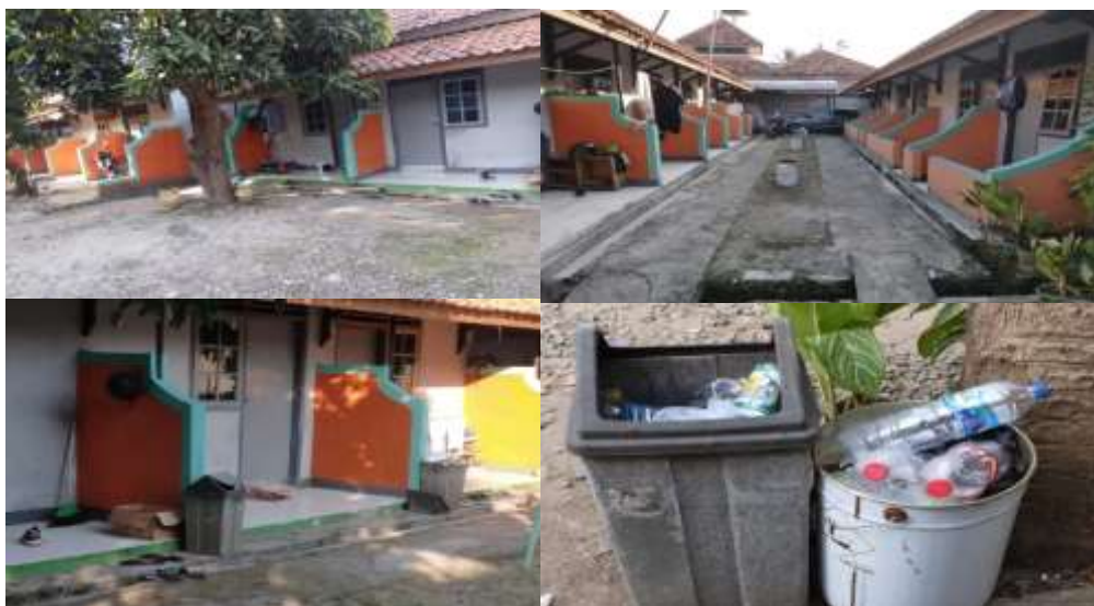
Gambar 2. Lokasi pemberdayaan anak kost lingkungan winaya

Metode pemberdayaan yang digunakan adalah metode kualitatif dengan pendekatan deskriptif, dimana nantinya menemukan suatu makna dalam kegiatan pemberdayaan yang dilaksanakan di lingkungan winaya RT 03 RW 03 kelurahan Panancangan kecamatan Cipocok Jaya Kota-Serang Banten. Adapun lokasi pengabdian masyarakat mengenai pemberdayaan anak kost di lingkungan winaya RT 03 RW 03 pada kecamatan Panancangan kecamatan Cipocok Jaya Kota Serang Banten, seperti pada Gambar 2 berikut ini.