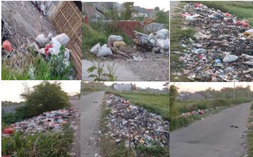
Gambar 6. Pembuangan sampah di pinggir jalan

membakar sampah dan membuang sampah ke kebun, pinggir jalan, sungai dan sebagainya seperti yang diperlihatkan pada Gambar 6 di bawah ini.