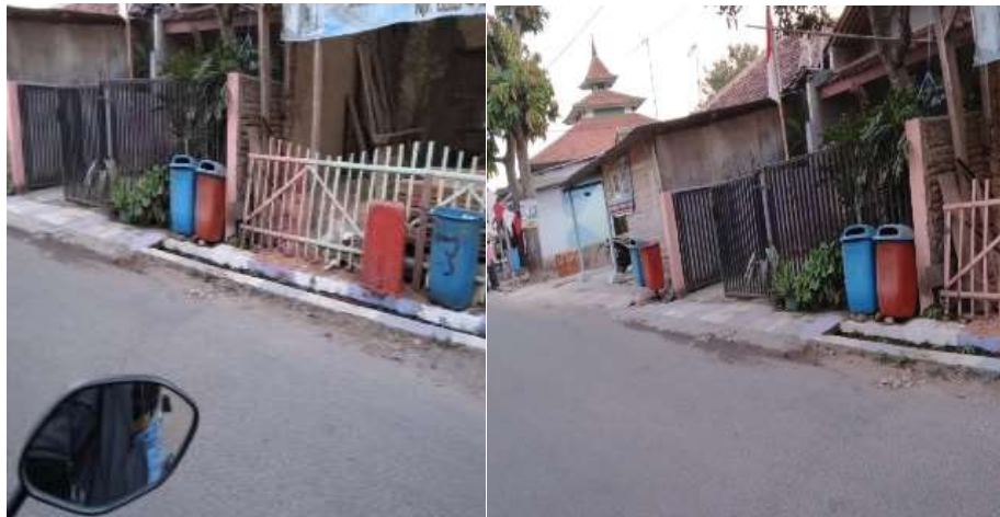
Gambar 5. Tempat sampah di Lingkungan Winaya RW 03 RT 03

Kegiatan penyuluhan dilaksanakan satu minggu setelah kegiatan sosialisasi awal dilaksanakan. Kegiatan ini bertujuan untuk memberikan pengetahuan dan pemahaman secara teori mengenai perlunya kesadaran lingkungan dan pengolahan sampah. Kegiatan ini dilakukan dengan metode pemaparan materi yang dilanjutkan dengan sesi tanya jawab. Beberapa pertanyaan yang muncul saat berlangsungnya sesi tanya jawab diantaranya: alat dan bahan apa saja yang harus disiapkan; bagaimana pemeliharaan prasarana dan sarana pengolahan sampah; lokasi dan tempat pengolahan sampahnya dimana; serta beberapa pertanyaan lainnya. Ada pun tempat pembuangan sampah di masyarakat seperti yang diperlihatkan pada Gambar 5 di bawah ini. Kelihatannya tempat sampah tidak dipelihara sama masyarakat sehingga pembuangan sampah terbenkalai. Sepertinya masyarakat merasa cuek dengan kondisi sampah yang ada disekeliling lingkungannya.