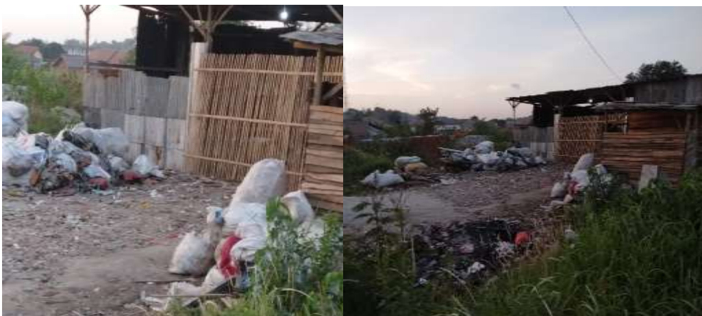
Gambar 7. Tempat Penjualan sampah

Penyelesaian masalah sampah tidak hanya dilakukan dengan mengandalkan petugas kebersihan saja. Seluruh lapisan masyarakat harus membantu pemerintah untuk bergerak bersama dalam menangani masalah sampah dengan penerapan sistem 3 R ( reduce, reuse, recycle ) dalam wujud bank sampah di Anak kost putra di lingkungan winaya. Sistem ini berguna untuk mengelola sampah dengan menampung, memilah, dan mendistribusikan sampah kefasilitas pengolahan sampah dalam hal ini ke TPS, sehingga sampah di tempat pembuangan akhir bisa berkurang bahkan bisa bernilai ekonomis. Adapun tempat pembuangan sampah yang terakhir seperti pada Gambar 7 di bawah ini.