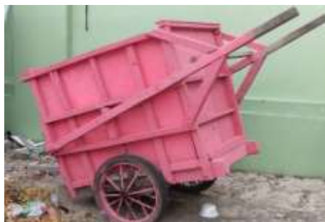
Gambar 1. Gerobak sampah

Pengurangan sampah sudah dimulai dari masyarakat itu sendiri khususnya rumah sendiri atau tempat kost, dimana dengan cara itu bisa membudayakan membuang sampah pada tempatnya dan memisahkan sampah kering dan basah sehingga dapat di daur ulang dan bisa dimanfaatkan sehingga memiliki nilai ekonomi bagi masyarakat. Program ini sudah disosialisasikan kepada anak kost putra lingkungan winaya pada kelurahan Panancangan Kecamatan Cipocok Jaya Kota Serang-Banten. Namun belum terlihat perubahan yang signifikan dalam mengatasi permasalahan sampah tersebut (Sri Indriyani & Srie Isnawaty Pakaya, 2019). Permasalahan sampah di lingkungan kalurahan Panancangan kecamatan Cipocok Jaya Kota Serang sangat krusial, terutama dalam hal pembuangan sampah yang cukup sulit, karena melihat kondisi lingkungan yang begitu sempit dan banyak perumahan, sehingga tempat untuk pembuangan sampah sudah tidak ada. Dampaknya tempat sampah sangat diperlukan, selain itu juga permasalahan pembuangan sampah yang begitu jauh, sehingga mengakibatkan masyarakat malas. Armada yang digunakan untuk pengambilan sampah mulai dari perumahan di ambil dengan armada gerobak sampah, kemudian baru dikumpulkan di bawah ketempat pembuangan sampah akhir, setelah terkumpul baru diangkut oleh gerobak sampah, seperti pada Gambar 1 di bawah ini.