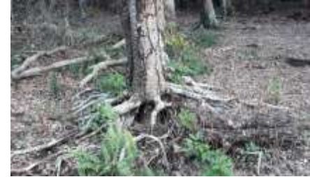
Gambar 7. Akar tanaman karet

Gangguan terhadap ekosistem gambut telah menimbulkan dampak yang cukup parah dilihat pada kebun-kebun masyarakat di Lukun. Karena keringnya lahan gambut mengakibatkan pertumbuhan tanaman sagu mereka terkendala. Menurut masyarakat setempat, hal ini mengakibatkan daun tanaman sagu tidak tumbuh subur sehingga batang Sagu tidak terlalu tinggi dan berdiameter kecil. Mengeringnya lahan gambut pada kebun karet menyebabkan permukaan tanah menjadi turun dan menurunkan produktifitas tanaman. Perakaran pohon karet yang muncul ke permukaan tanah membuktikan adanya penurunan tanah yang terjadi dari waktu ke waktu di Desa Lukun.