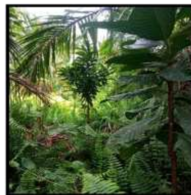
Gambar 3. Tanaman sela di Perkebunan Sagu

Masyarakat Desa Lukun melakukan revegetasi dengan sistem paludikultur. Paludikultur berasal dari bahasa latin (palus) berarti rawa. Paludikultur berarti penggunaan lahan rawa (dan rawa gambut) secara produktif dengan cara-cara melindungi gambut. (Joosten, et al. 2012). Kegiatan paludikultur yang telah diterapkan merupakan upaya restorasi dan rehabilitasi ekosistem rawa gambut yang terdegradasi, terutama akibat pembukaan kanal/drainase serta kebakaran hutan pada lahan gambut. Praktik paludikultur yang diterapkan secara tradisional oleh masyarakat lokal adalah praktik budidaya tanaman yang telah beradaptasi di rawa dan rawa gambut seperti budidaya tanaman sagu.