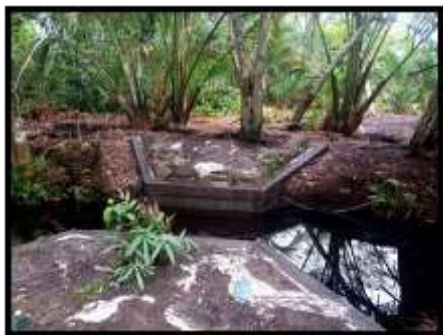
Gambar 2. Kondisi Sekat Kanal di Desa Lukun b. Revegetasi (penanaman kembali)

Revegetasi adalah upaya pemulihan tutupan lahan pada ekosistem gambut melalui penanaman jenis tanaman asli pada fungsi lindung ekosistem gambut atau dengan jenis tanaman lain yang adaptif terhadap lahan basah dan memiliki nilai ekonomi pada fungsi budidaya. Gambut adalah jenis tanah yang memiliki keasaman yang tinggi sehingga diperlukan perlakuan khusus dalam melakukan revegetasi. Tanaman sagu merupakan jenis tanaman populer di Desa Lukun dan merupakan salah satu komoditas pilihan untuk revegetasi karena penanamannya yang sederhana dan tidak membutuhkan banyak perawatan. Hal ini sesuai dengan pernyataan Bintoro, et al. (2008) bahwa tanaman sagu dapat tumbuh pada berbagai kondisi hidrologi dari yang terendam air sampai ke lahan yang tidak