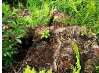
Gambar 6. Tunggul tanaman sagu bekas terbakar

Gangguan terhadap ekosistem gambut telah menimbulkan dampak yang cukup parah dilihat pada kebun-kebun masyarakat di Lukun. Karena keringnya lahan gambut mengakibatkan pertumbuhan tanaman sagu mereka terkendala. Menurut masyarakat setempat, hal ini mengakibatkan daun tanaman sagu tidak tumbuh subur sehingga batang Sagu tidak terlalu tinggi dan berdiameter kecil. Mengeringnya lahan gambut pada kebun karet menyebabkan permukaan tanah menjadi turun dan menurunkan produktifitas tanaman. Perakaran pohon karet yang muncul ke permukaan tanah membuktikan adanya penurunan tanah yang terjadi dari waktu ke waktu di Desa Lukun.