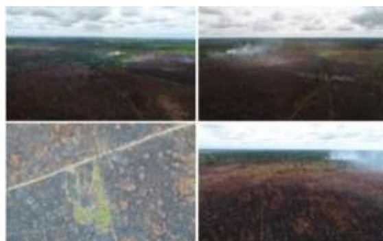
Gambar 4. Kebakaran di Ulu Mamud tahun 2018

lokasi yang jauh dari kampung yang jarang didatangi orang ( Gambar 4). Kebakaran terjadi di seberang sungai dari pemukiman. Kebakaran pernah terjadi di daerah Pantuk namun masih bisa cepat ditanggulangi oleh masyarakat karena lokasi kebakaran agak dekat dengan jalan dan terdapat sekat kanal sehingga mudah dalam pengambilan air untuk memadamkannya.