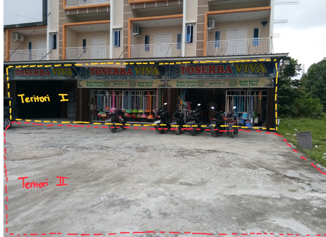
Gambar 2. Dokumentasi Toserba Viva

Toserba Viva berada di jalan Kubang Raya Kota Pekanbaru dan berjarak kurang lebih 10 meter dari jalan raya. Jarak 10 meter ini digunakan sebagai lahan parkir pengunjung Toserba Viva. Teritori 1 gambar diatas merupakan bagian dari fasad Toserba Viva sedangkan teritori 2 merupakan lahan parkir Toserba Viva. Ruang yang dibuat oleh teritori 1 dan 2 memberikan fungsi safety . Berdasarkan penelitian Edward T. Hall, fungsi ruang safety memberikan rasa aman karena keyakinan tidak akan yang menyerang (5). Teritori 2 sengaja dirancang dengan ukuran besar agar pengunjung dapat leluasa menyimpan kendaraannya terparkir pada area Toserba tanpa khawatir kendaraannya akan hilang atau di parkir dibahu jalan.