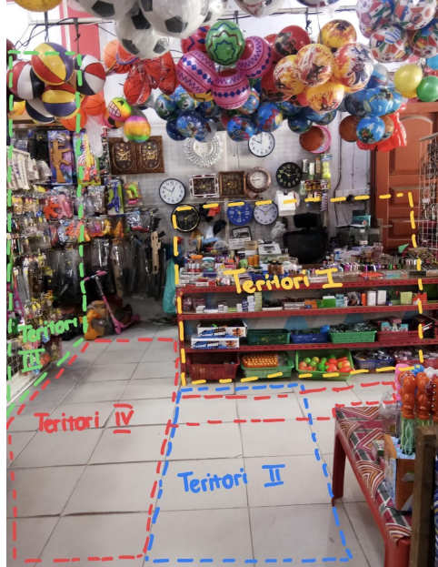
Gambar 3. Dokumentasi Toserba Viva

Teritori 1 pada gambar diatas merupakan area bertransaksi antara Toserba dengan pembeli. Pada area teritori 1 ini terdapat mesin kasir dan proses penghitungan barang yang akan dibeli di toko. Susunan barang dibuat melingkar mengikuti area mesin kasir dengan satu jalan keluar. Ruang yang dibuat pada teritori 1 dibuat safety karena diperlukan jarak aman antar orang lain namun juga dibarengi dengan ruang threat yang perlu adanya ancaman apabila melanggar atau memasuki area teritori 1 ini (5). Ruang ancaman dapat terbentuk dari ruang yang sulit diakses dan penjagaan yang cukup ketat seperti mengaplikasikan cctv pada ruang tersebut. Zona jarak yang diperbolehkan pada teritori 1 adalah jarak intim. Jarak intim adalah jarak kurang dari 50 cm dan hanya dapat diakses oleh orang terpercaya saja (5).