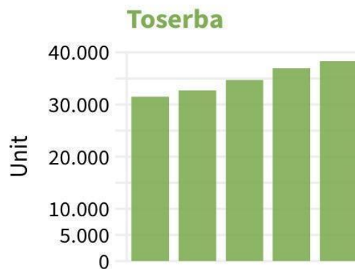
Gambar 1. Jumlah Unit Toserba Tahun 2021

Pertumbuhan retail di Indonesia mengalami peningkatan setiap tahunnya. Berdasarkan CEIC Data, pada tahun 2023 bulan Maret ini sudah tercatat kenaikan jumlah retail di Indonesia sebesar 4,8%. Menurut Sunyoto pada tahun 2015, retail didefinisikan sebagai semua usaha meliputi barang dan jasa yang dipasarkan langsung kepada konsumen (1). Salah satu bentuk retail yang berkembang di Indonesia adalah Toserba atau toko serba ada. Menurut DataIndonesia.id yang mengutip dari Euromonitor, jumlah Toserba di Indonesia mengalami kenaikan dari tahun 2017 sampai dengan tahun 2021 (2).