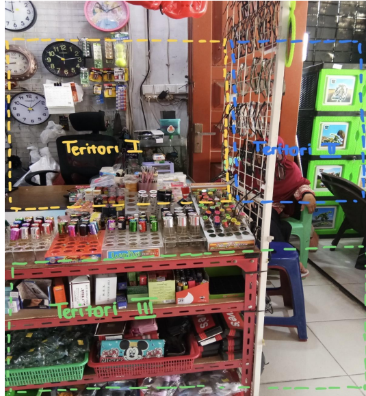
Gambar 5. Dokumentasi Toserba Viva

Territori 1 pada gambar diatas adalah area bertransaksi. Territori 1 ini sama dengan territori 1 pada gambar kedua yang memiliki tingkat pengamanannya tinggi. Pada area 1 ini hanya orang-orang tertentu yang dapat memasuki ruang ini. Territori 2 pada gambar diatas merupakan area duduk untuk pengunjung Toserba Viva dan sales pemasok barang di Toserba Viva ini. Pada area ini meskipun dibatasi oleh meja dengan territori 1, namun area ini dibuat agar ruang territori 2 menjadi ruang affection . Ruang affection adalah ruang-orang yang dekat dan dapat menjalin keakraban dengan mengobrol pada ruangan ini (5). Meskipun terlihat sederhana, namun area ini menjadi tempat favorit sebagian pengunjung tetap yang sudah dekat dengan pemilik Toserba Viva dan beberapa sales pemasok barang ke Toserba ini. Zona jarak yang dibuat pada territori 2 ini adalah jarak personal. Jarak tersebut berada pada 50 cm sampai dengan 1.5 m. Pada jarak ini intonasi suara yang dikeluarkan tidak sebesar jarak sosial, namun tidak sampai intonasi suara bisik-bisik. Jarak komunikasi yang digunakan mengisyaratkan status orang-orang tertentu yang bisa mengobrol dengan waktu yang lama pada territori 2 ini.