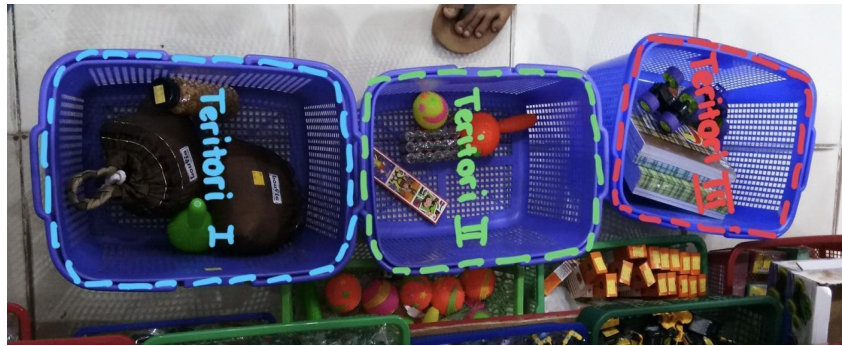
Gambar 6. Dokumentasi Toserba Viva

Teritori 1, 2 dan 3 pada gambar diatas merupakan batas jarak yang dibuat oleh masing-masing pengunjung Toserba Viva. Pengunjung menyimpan barang yang ingin dibelinya pada kasir depan toserba dengan menandainya menggunakan keranjang belanja kemudian melanjutkan mencari barang lainnya pada display Toserba Viva lainnya. Zona yang dibuat pada teritori ini adalah zona pribadi dengan jarak 50 m hingga 1.5 m. Teritori ini berada pada area mengantri barang sebelum barang tersebut dibungkus dan dihitung total keseluruhannya.