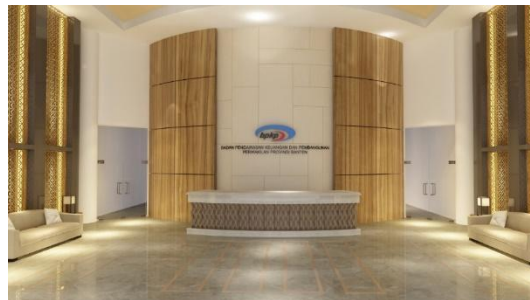
Gambar 7. Perspektif 3: tampilan desain interior lobby

Gambar ketiga menyoroti meja resepsionis yang dirancang dengan garis bersih dan tekstur kayu alami, ditambah dengan panel batik Surosowan sebagai aksen. Desain ini memfasilitasi fungsionalitas kerja sehari-hari sambil menyediakan titik fokus visual yang kuat untuk mengidentifikasi ruang masuk.