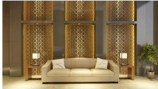
Gambar 5. Perspektif 1: area duduk pada lobby

Gambar pertama menampilkan wall treatment lobby dengan motif batik Surosowan yang diimplementasikan pada panel-panel logam. Pencahayaan yang cermat dengan menonjolkan motif, menciptakan kontras yang menarik dengan dinding latar dan lantai marmer yang mewah. Detail logam memberikan tekstur dan dimensi yang memperkaya pengalaman visual pengunjung.