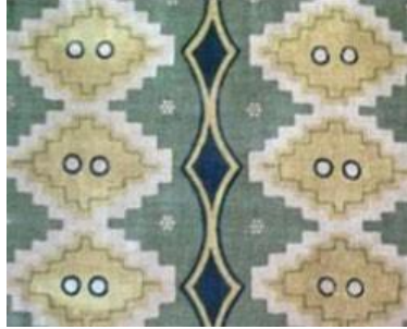
Gambar 3. Motif Batik Surosowan