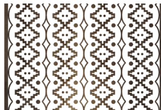
Gambar 4. Wall treatment dengan motif Batik Surosowan

Hasil desain lobby Kantor BPKP Banten merupakan cerminan dari konsep dan penerapan teori yang telah diuraikan sebelumnya. Gambar-gambar perspektif yang disertakan dalam jurnal ini menunjukkan penerapan konsep secara visual dan memberikan gambaran yang jelas tentang bagaimana desain akan terwujud dalam kenyataan.