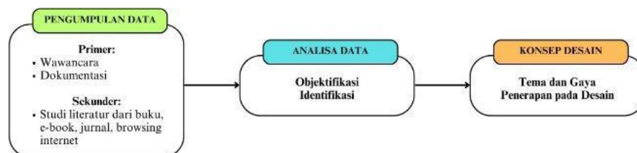
Gambar 1. Bagan Metode Penelitian

Selanjutnya, tahap analisis data dilakukan guna membantu identifikasi cara-cara inovatif untuk mengimplementasikan motif batik ke dalam desain lobby kantor. Berdasarkan analisis ini, konsep desain dikembangkan dengan mempertimbangkan estetika, fungsi, dan identitas budaya khas Banten. Tahap akhir melibatkan eksplorasi konsep desain dan penerapan sebagai solusi desain melalui pemilihan material, dan penyesuaian elemen desain lainnya untuk menciptakan suasana yang unik dan mencerminkan kekayaan budaya Banten. Hasilnya adalah desain lobby yang menarik secara visual, fungsional serta memiliki identitas yang kuat dengan menggabungkan motif batik Surosowan sebagai simbol budaya lokal.