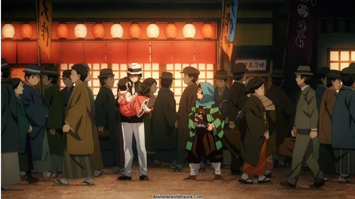
Gambar 9. Visualisasi Latar Pada Salah Satu Adegan dalam Film Demon Slayer