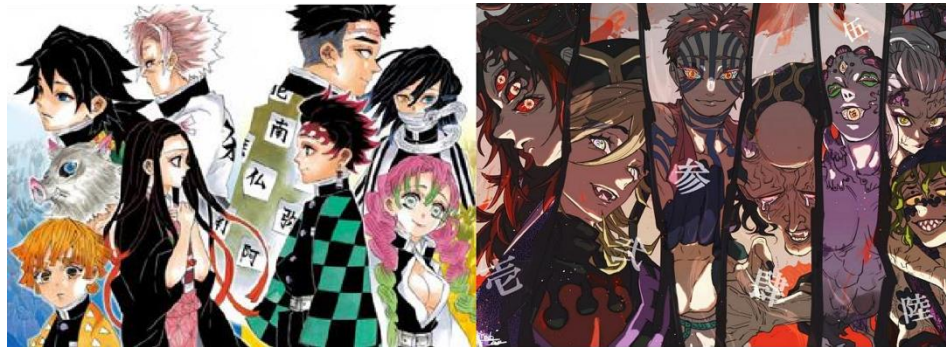
Gambar 2. Tokoh Protagonis (kiri) dan tokoh-tokoh Antagonis (kanan)

antagonis. Meskipun alur cerita ini terkesan klise, keunikan manga ini terletak pada elemen visual yang berbeda dari manga lainnya, karena gaya seni lukisan Ukiyo-e Jepang yang dimodernisasi menjadi sesuatu yang sangat indah, terutama dalam versi anime. Serial ini menyoroti tema kesetiaan dalam hubungan antar karakter, yang dipengaruhi oleh faktor-faktor seperti kekaguman dan cinta, yang dapat menghasilkan konsekuensi baik maupun buruk (Kolondam et al., 2023).