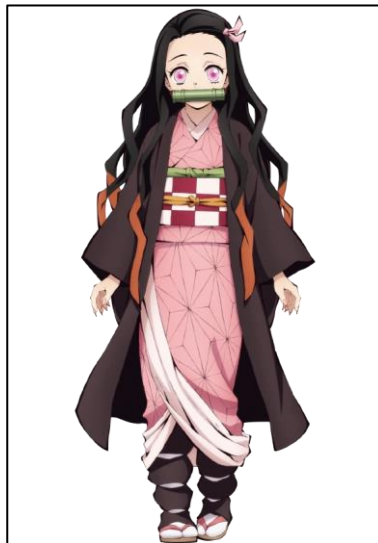
Gambar 7. Desain Kostum Nezuko Kamado mencirikan Pakaian Tradisional Jepang Yukata

Karakter Nezuko, adik perempuan Tanjiro yang berubah menjadi iblis, mengenakan kimono berwarna merah muda, visual ini mencerminkan kesan kelembutan dan femininitas meskipun Nezuko telah berubah menjadi iblis. Kimono yang dikenakan Nezuko ini dipadukan dengan obi bambu yang berfungsi sebagai penghambat insting iblisnya dalam penceritaan. Simbolisme bambu dalam budaya Jepang menggambarkan kekuatan dan fleksibilitas, bambu juga dijadikan sebagai simbol kesuburan dan kehidupan.