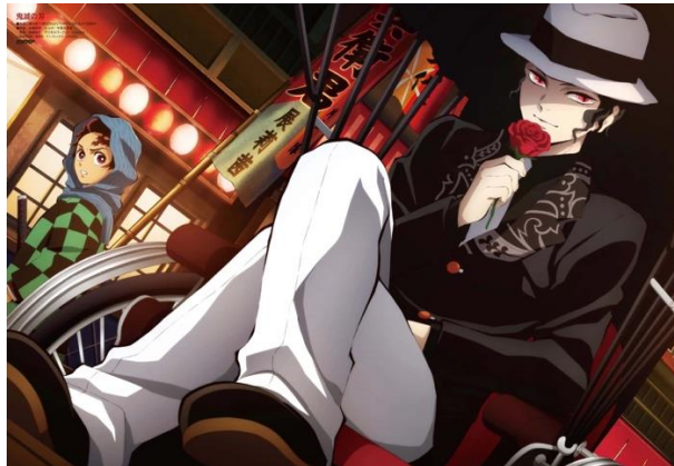
Gambar 8. Visualisasi Desain Kostum Muzan Kibutsuji

Kemudian pada karakter Muzan Kibutsuji, memperlihatkan visual pakaian yang mengadaptasi dari gaya ke barat-baratan. Hal ini terlihat dari gaya fashionnya yang flamboyan, memperlihatkan kesan yang misterius dan elegan. Sesuai dengan karakter nya yang penuh intrik dalam penceritaan. Hal ini cukup relevan karena pada era Taisho, budaya berpakaian masyarakat Jepang cukup banyak dipengaruhi oleh gaya fashion Barat.