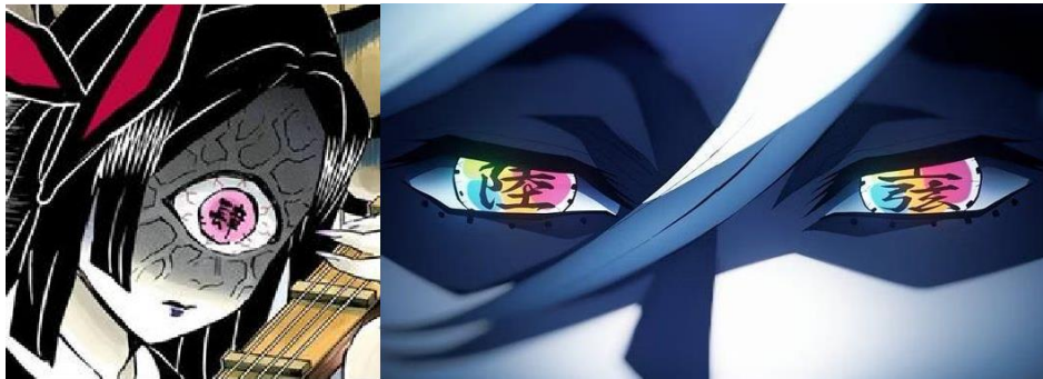
Gambar 4. Kaligrafi Di Mata Tokoh

muncul dalam cerita. Seperti halnya filosofi kaligrafi yang menganggap setiap kata memiliki makna, kaligrafi yang terdapat di mata iblis juga memiliki makna filosofis tersendiri. Dalam "Demon Slayer," antagonis memiliki organisasi yang terstruktur, di mana hierarki setiap anggotanya tercermin dari kaligrafi yang mereka miliki. Kaligrafi tersebut dibagi menjadi tingkat atas dan bawah, dan masing-masing memiliki makna filosofis yang mencerminkan kepribadian serta kekuatan dan tingkat hierarki mereka.