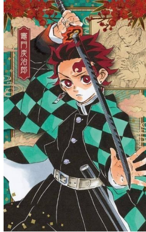
Gambar 1. Tanjiro Kamado Tokoh Protagonis dalam Manga Demon Slayer: Kimetsu No Yaiba

pemikiran seperti manusia. Hal ini mendorong Tanjiro untuk bergabung dengan Demon Slayer Corps demi mencari cara menyembuhkan adiknya.