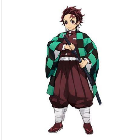
Gambar 6. Visualisasi Desain Kostum Tanjiro Kamado