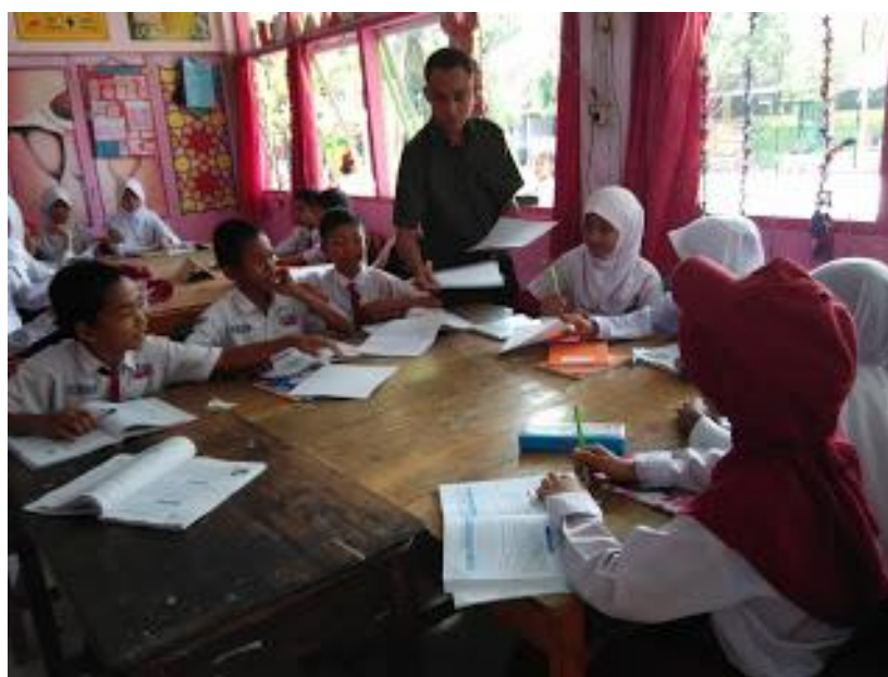
Gambar 3. Proses penerapan pembelajaran kooperatif dan demonstratif learning