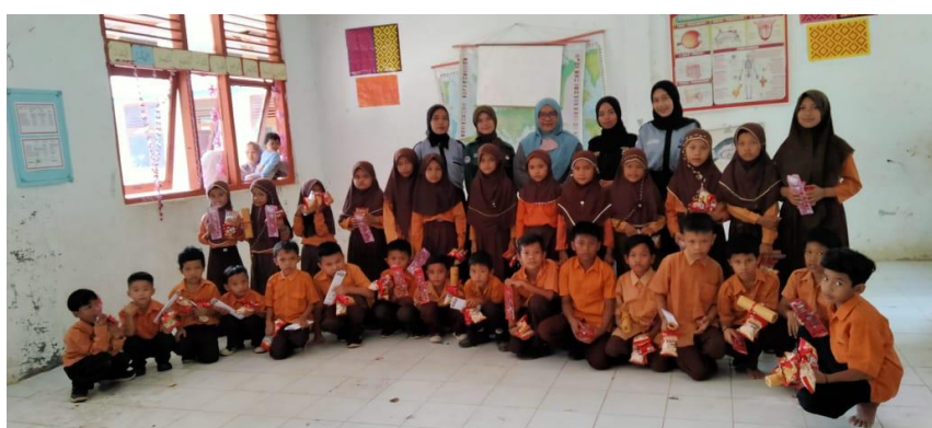
Gambar 4. Setelah Penerapan PBM dengan metode kooperatif dan demonstratif