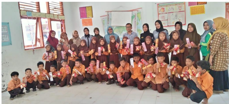
Gambar 2. Pemberian Reward untuk siswa yang aktif didalam kelas