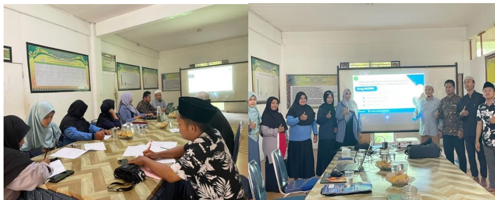
Gambar 4. Sosialisasi dan Pelatihan Aplikasi Koperasi