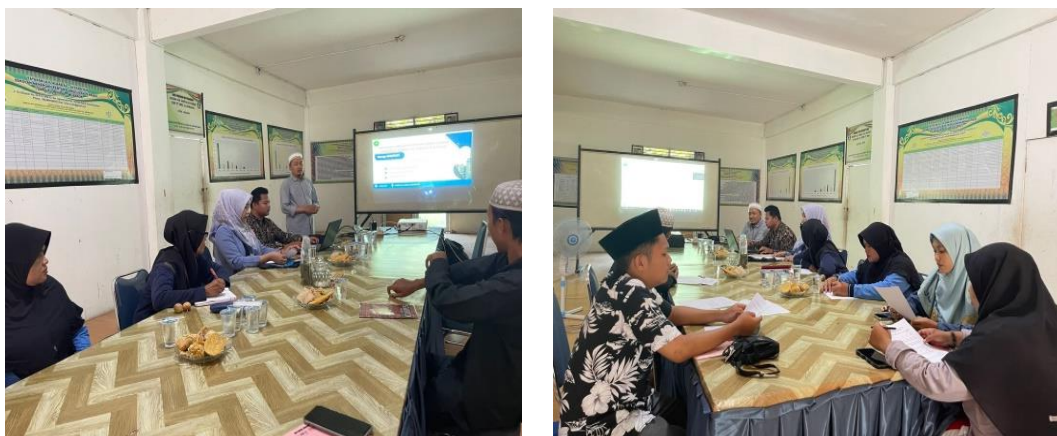
Gambar 2. Sosialisasi dan Pemaparan Pelatihan Aplikasi Koperasi