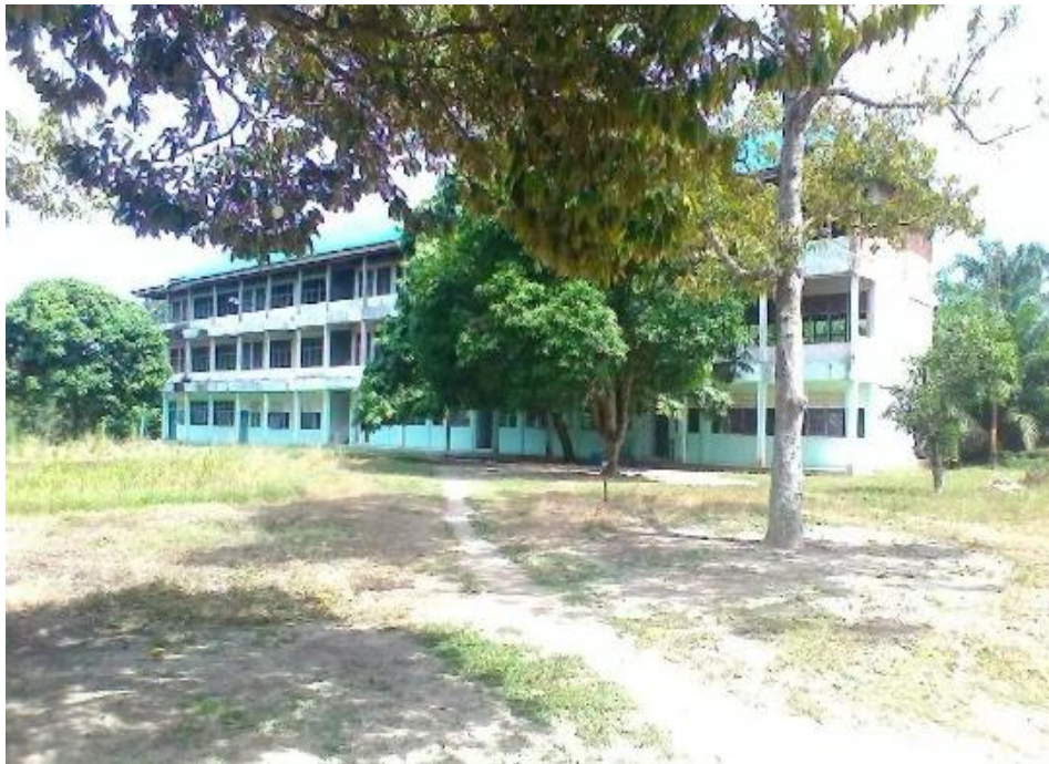
Gambar 1. Gedung Ponpes Ulil Albab Alja'afariyah

Perkembangan ilmu pengetahuan dan teknologi semakin mendorong pembaharuan dalam pemanfaatan teknologi dalam media promosi. Instagram merupakan salah satu media yang digunakan untuk melakukan promosi, dimana jangkauan instagram saat ini sangat luas. Pengguna internet yang menggunakan Instagram pun sekarang sangat banyak. Untuk membuat konten yang menarik pada Instagram, maka penggunaan aplikasi lain yang mendukung juga sangat diperlukan. Salah satunya adalah menggunakan Aplikasi Canva.