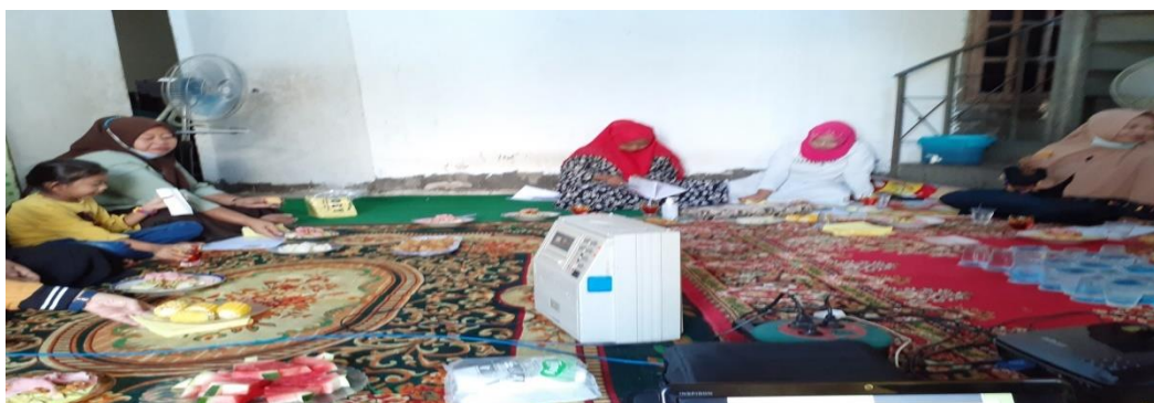
Gambar 3. Dokumentas Foto Kegiatan