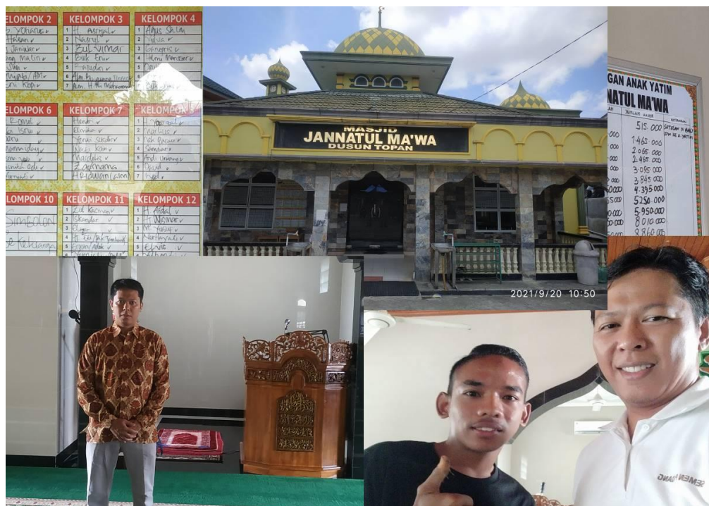
Gambar 3. Hasil Kegiatan Pengabdian

Tingkat keberhasilan dari pelatihan pembuatan desain spanduk diukur menggunakan kuisoner yang diberikan kepada peserta pelatihan. adapun bentuk kuisoner yang diberikan kepada peserta dibagikan pada saat pra-pelatihan dan pasca-pelatihan; seperti table berikut.