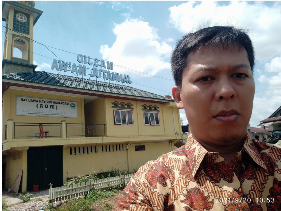
Gambar 2. Survey Pra-kegiatan IbM oleh Tim

Pada gambar diatas dapat dilihat tim melakukan dokumentasi ke lokasi pengabdian yaitu di Desa Koto taluk.