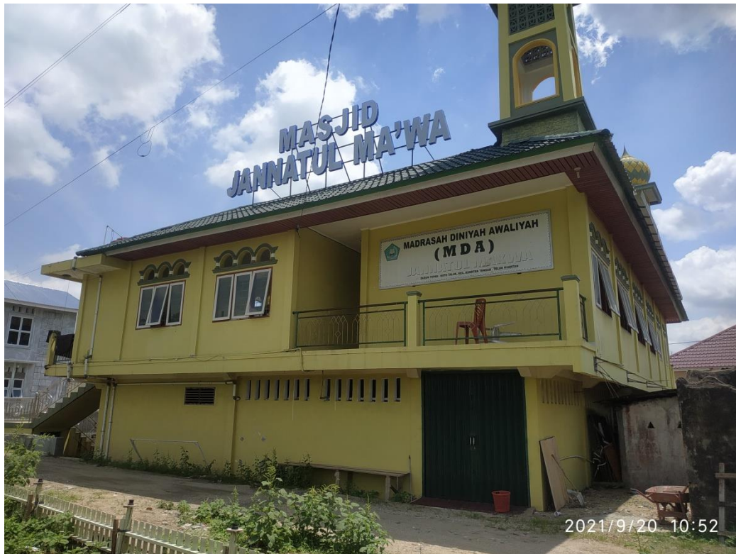
Gambar 1. Mesjid Jannatul Ma'wa

Komponen pengaturan administrasi yang berkaitan dengan keuangan didalam masjid dapat dilakukan dengan baik apabila salahsatu poin pendukung diantaranya tingkat pelaporan yang baik. Dalam proses pelaksanaannya kegiatan kepengurusan internal dan eksternal masjid dilakukan oleh pengurus yang di tunjuk masyarakat yang ada di lingkungan desa tersebut, dimana pengurus akan menunjuk beberapa tenaga muda yang di sebut dengan "Garin". Secara umum kami melihat ini adalah salah satu bentuk kegiatan yang bersifat social work(Aydemir & Yiğit, 2017). Dimana pengurus tidak digaji secara langsung oleh struktur yang telah disepakati.