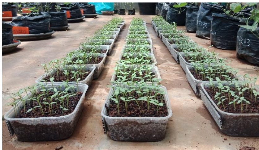
Gambar 1. Perkecambahan benih cabai merah kedaluwarsa