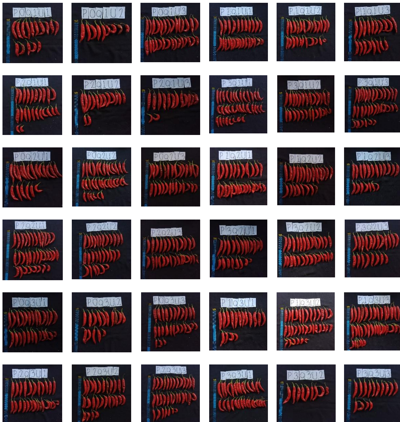
Gambar 3. Hasil panen cabai merah dari benih kedaluwarsa

Fase produksi atau fase generatif tanaman cabai merah meliputi proses pembungaan sampai dengan pembentukan buah. Pada penelitian ini tanaman cabai merah dari benih kedaluwarsa memiliki umur panen yang sama dengan deskripsi varietas yaitu 58 hari setelah tanam. Hasil panen pada penelitian ini dapat dilihat pada Gambar 3.