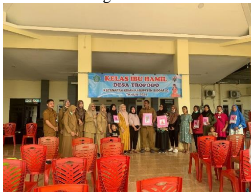
Gambar 1 : Kegiatan Kelas Ibu Hamil

Dari hasil penelitian diatas dilihat dari indikator ketersediaan anggaran, peran pemerintah desa tropodo dalam menyediakan atau mengelola anggaran desa sudah cukup baik, hal ini bisa dilihat dari pihak pemerintah desa selalu mengsupport dan memberi anggaran untuk kegiatan program pencegahan stunting. Anggaran dana desa ini digunakan untuk pencegahan stunting seperti untuk konsumsi kegiatan posyandu balita biaya transportasi kader, PMT untuk anak yang stunting, kelas ibu hamil dan kunjungan Balita yang terkena stunting. Berikut ini dokumentasi terkait program pencegahan stunting seperti kelas ibu hamil: