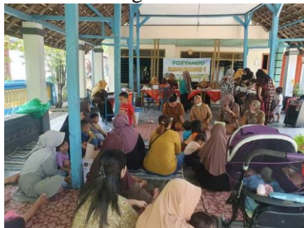
Gambar 2 : Kegiatan Kemitraan

Sumber Data : Pemerintah Desa Tropodo 2024