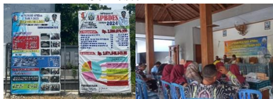
Gambar 3. Banner LPJ APB Desa Kedungsumber dan Kegiatan Laporan Realisasi APB Desa Semester I 2024

Pertanggungjawaban di Desa Kedungsumber diwujudkan melalui pembuatan dokumen laporan pertanggungjawaban (LPJ) keuangan desa yang terstruktur, transparan, dan melibatkan masyarakat dalam setiap tahapannya. Berdasarkan wawancara dengan Kepala Desa Kedungsumber, Ir. Kardi, LPJ APB Desa disusun dan disampaikan setiap semester. Laporan ini mencakup perencanaan, pelaksanaan, dan tahap akhir pertanggungjawaban, serta dibahas bersama masyarakat yang diundang untuk berpartisipasi dan memberikan masukan. Sebagai bentuk komitmen terhadap transparansi, APB Desa dan LPJ APB Desa dipublikasikan dalam musyawarah bersama warga, situs web resmi desa, dan banner di setiap dusun, yaitu Kedungsumber, Kricak, Tretes, dan Sugihan.