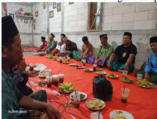
Gambar 5. Kegiatan jamaah tahlil di RT 3 Desa Kedungsumber pada Oktober 2024