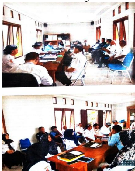
Gambar 7. Pengawasan dan Evaluasi Perangkat dan Staff Desa Kedungsumber