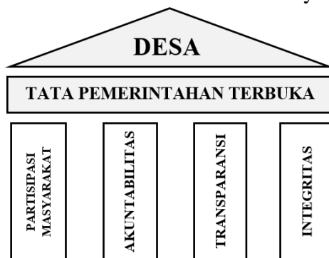
Gambar 2. Tata Kelola Pemerintahan Desa yang Terbuka.

Berdasarkan latar belakang tersebut, peneliti berminat untuk melakukan penelitian yang bertujuan mendeskripsikan dan menganalisis penerapan Open Government dalam upaya mewujudkan Desa Anti Korupsi di Desa Kedungsumber, yang telah terpilih sebagai nominator Desa Anti Korupsi. Penerapan Open Government di desa-desa antikorupsi seperti Kedungsumber menjadi model yang penting untuk ditiru, karena memperlihatkan bagaimana desa bisa meminimalisir potensi penyalahgunaan wewenang melalui keterbukaan informasi dan pengawasan masyarakat. Pendekatan ini tidak hanya meningkatkan akuntabilitas aparatur desa, tetapi juga membantu membangun kepercayaan masyarakat terhadap pemerintahan lokal. Dengan demikian, upaya mewujudkan desa antikorupsi di Indonesia dapat diakselerasi melalui penerapan kebijakan yang mendukung tata kelola pemerintahan yang lebih transparan dan partisipatif.