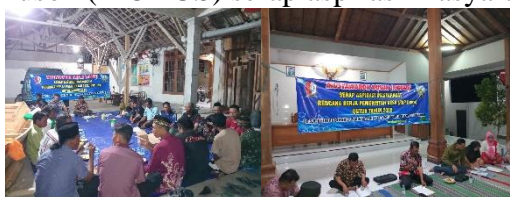
Gambar 6. Musyawarah Dusun (MODUS) serap aspirasi masyarakat RKP Desa 2025